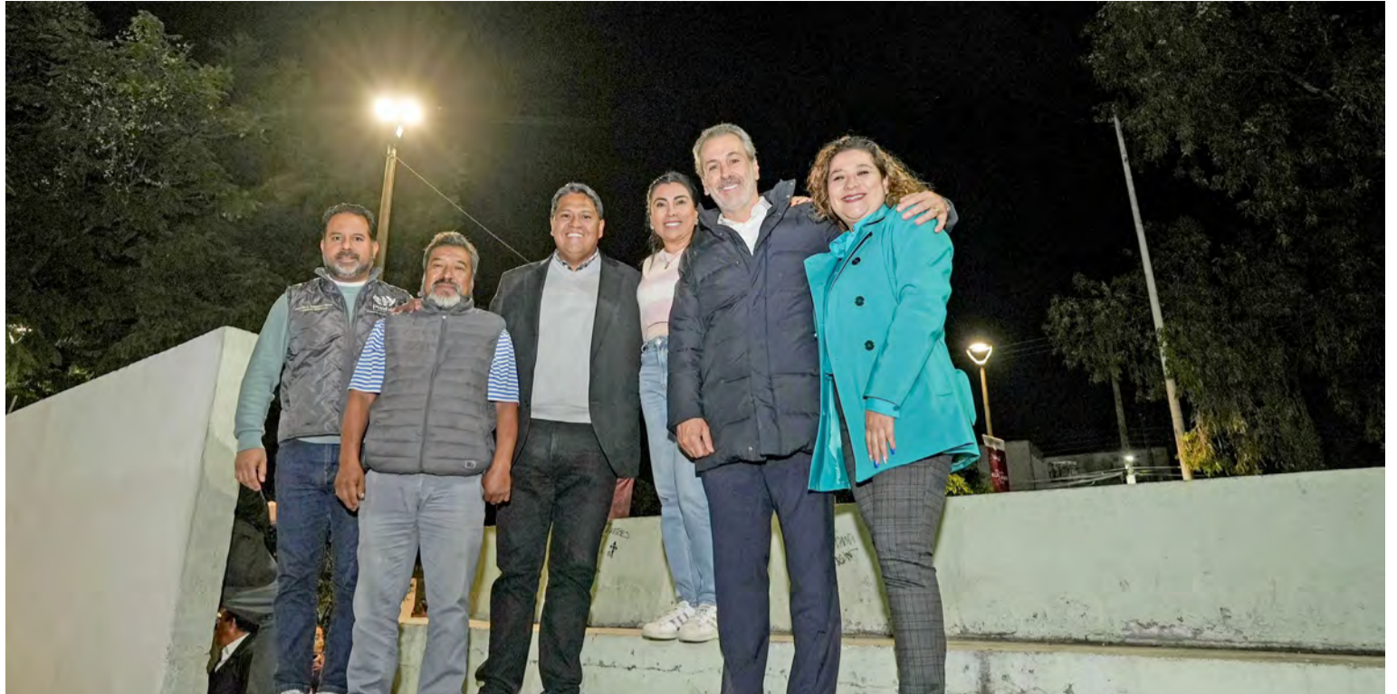
Las acciones se realizaron en el Parque La Coyotera de la Junta Auxiliar San Baltazar Campeche y en distintos puntos de la Junta Auxiliar La Libertad