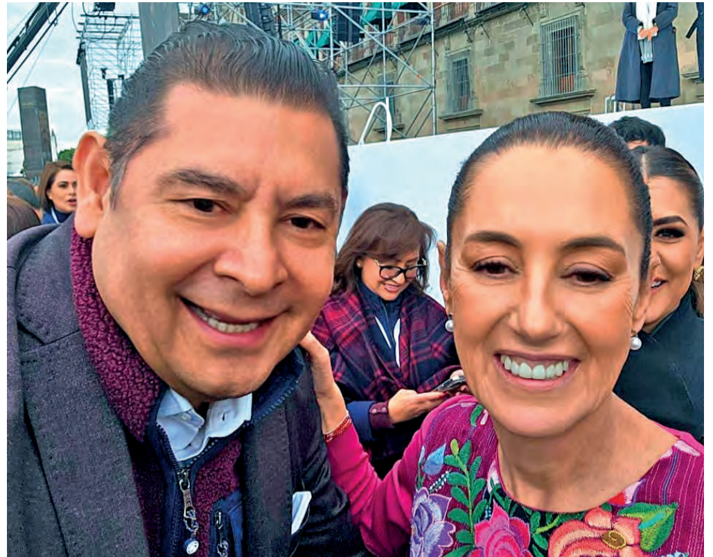
La aplicación del Plan de Seguridad de la presidenta Claudia Sheinbaum ha dado resultados favorables en Puebla y en todo el país.

Claudia Sheinbaum defendió a la población migrante que vive en Estados