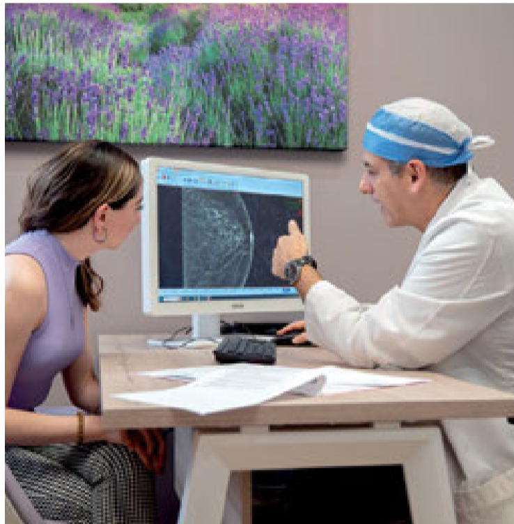
LOS ESPECIALISTAS ATIENDEN A PACIENTES SANAS que asisten a una mamografía de escrutinio y a las que tienen algún síntoma con sospecha de cáncer.

"es particularmente retador comparado con otro tipo de enfermedades debido a que muchos especialistas vemos a un solo paciente. Al menos lo ven entre cinco y siete, que incluyen: radiólogo, patólogo, cirujano, oncólogo médico, radiooncólogo, psicólogo, genetista, rehabilitador. Todos tenemos que estar de acuerdo en cuál va a ser la mejor secuencia del tratamiento", especifica la especialista.