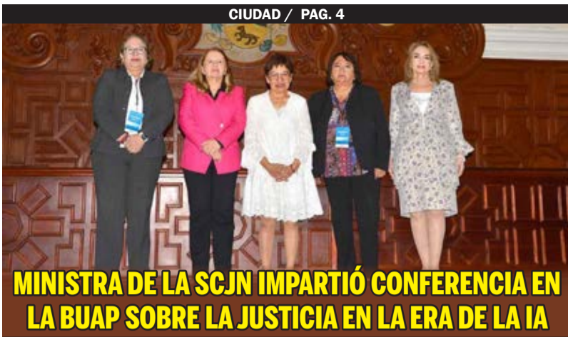
MINISTRA DE LA SCJN IMPARTIÓ CONFERENCIA EN LA BUAP SOBRE LA JUSTICIA EN LA ERA DE LA IA