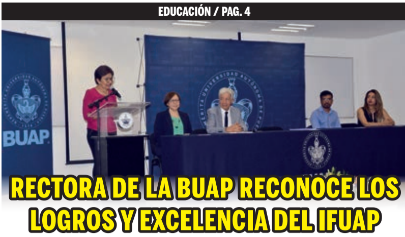
RECTORA DE LA BUAP RECONOCE LOS LOGROS Y EXCELENCIA DEL IFUAP