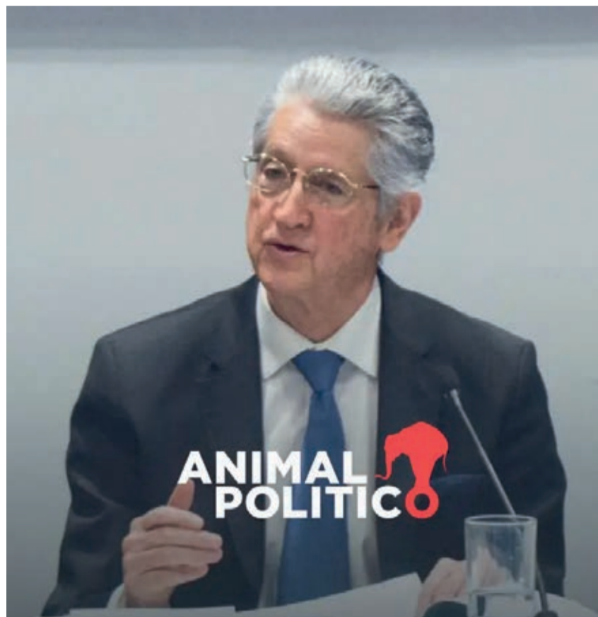
AGUSTÍN CASO FUE CESADO DE SU CARGO EN LA ASF EN ABRIL DE 2024.