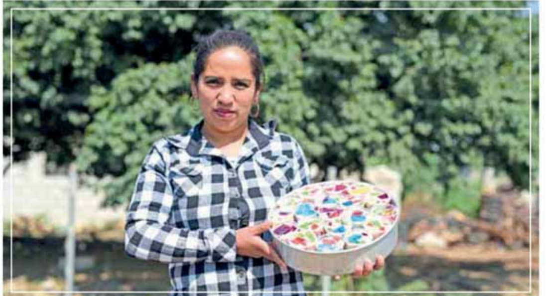
BENEFICIA GCM CON CURSOS A 1 MIL 100 PERSONAS EN 52 POBLACIONES