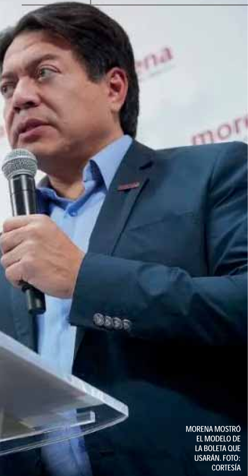
MORENA MOSTRÓ EL MODELO DE LA BOLETA QUE USARÁN.