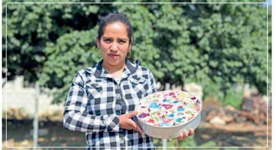
BENEFICIA GCM CON CURSOS A 1 MIL 100 PERSONAS EN 52 POBLACIONES