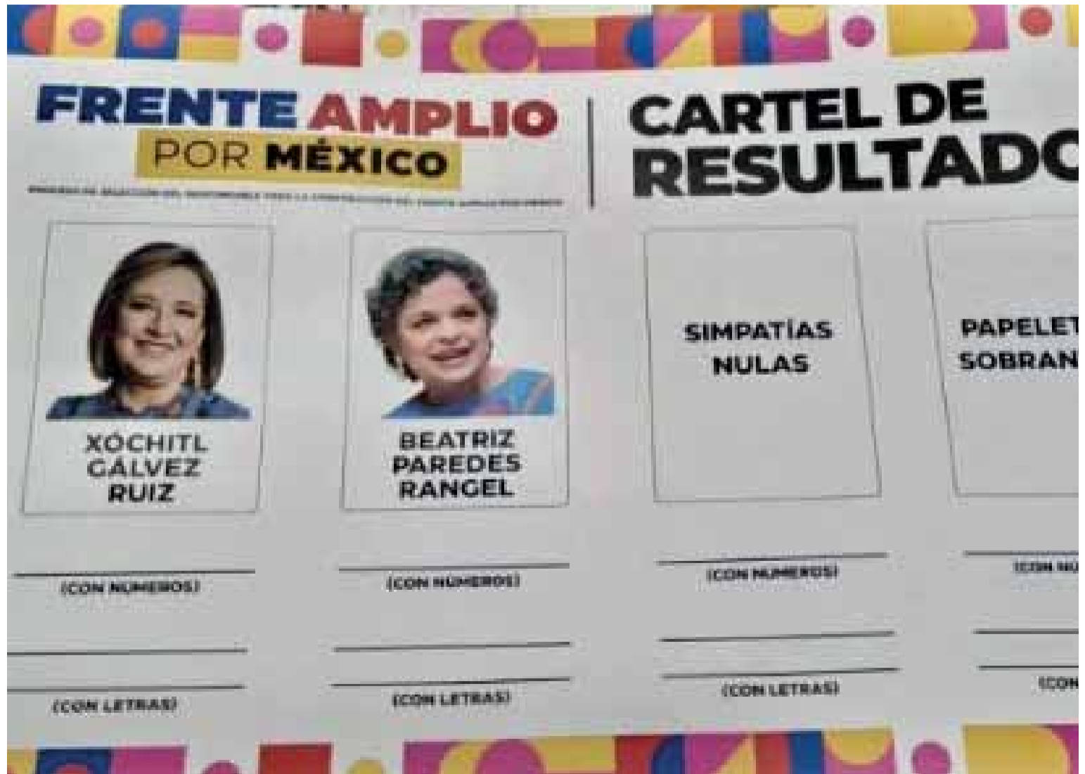
PLANILLA DE RESULTADOS DEL FRENTA. FOTO: @COMITEFAM