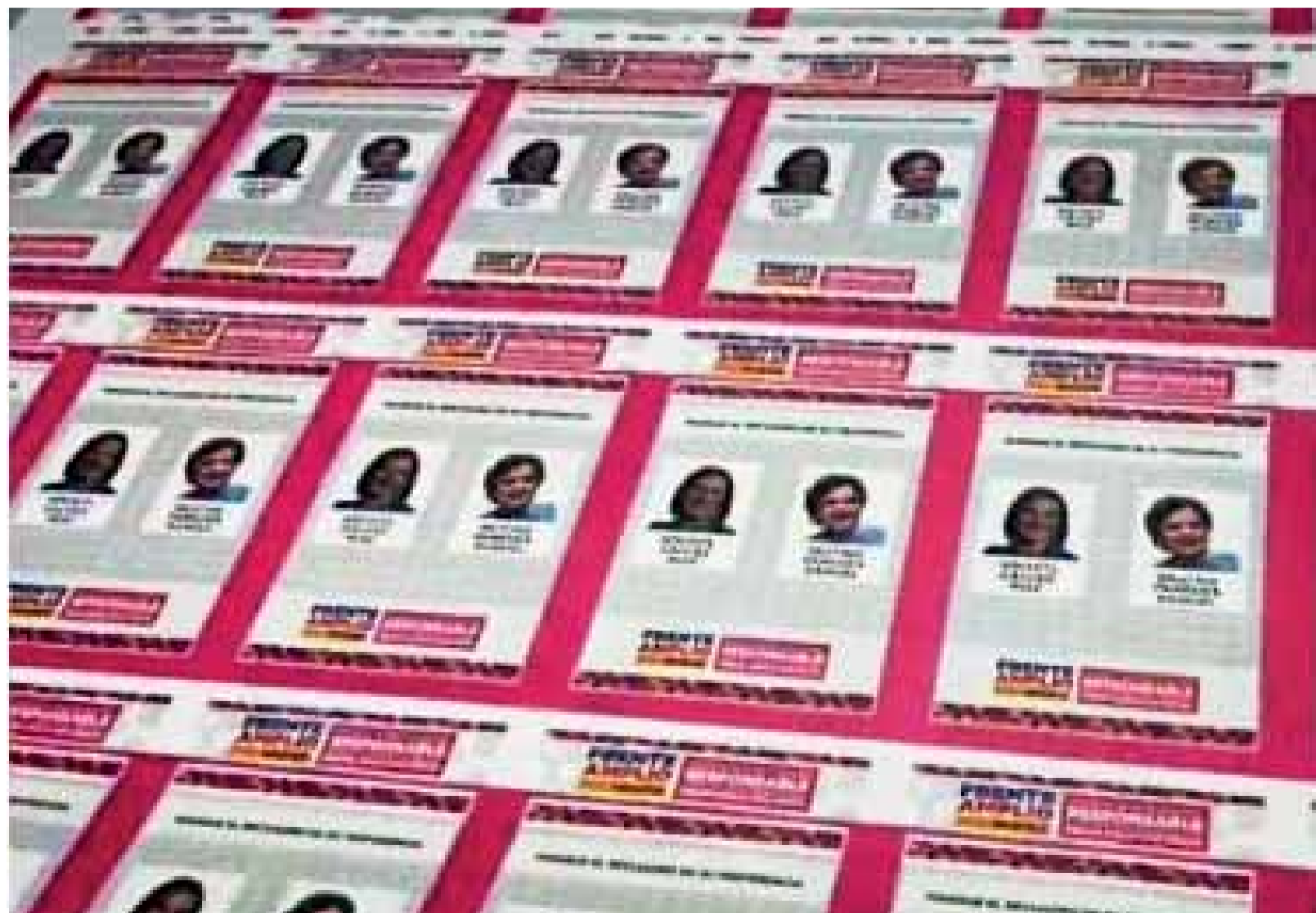
BOLETA QUE USARÁN EN EL FRENTE PARA ELEGIR A SU CANDIDATA.