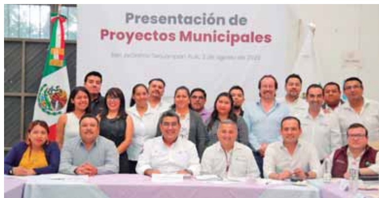
EL GOBERNADOR DURANTE UNA REUNIÓN DE TRABAJO CON AUTORIDADES DEL MUNICIPIO DE SAN JERÓNIMO TECUANIPAN