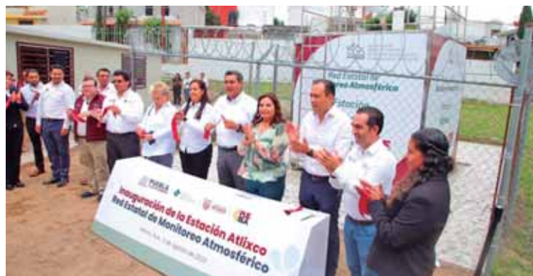
SERGIO SALOMÓN INAUGURÓ UNA ESTACIÓN DE MONITOREO EN EL MUNICIPIO DE ATLIXCO