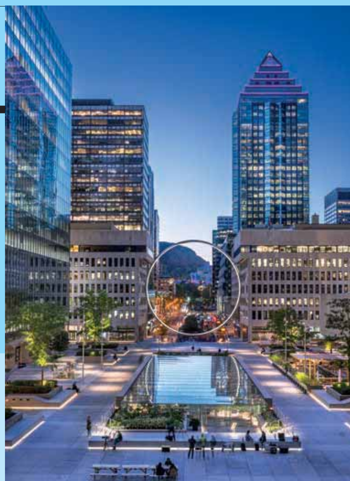
23 TONELADAS. Anillo de acero de 30 metros de diámetro suspendido en la entrada principal de la explanada de la Place Ville Marie.

El Parque Frédéric-Back es un nuevo escenario verde dedicado al medioambiente, la cultura, el ocio y el deporte. Finalmente, la Maison du développement durable es el primer edificio certificado LEED® Platinum NC en Quebec. El recinto ofrece visitas guiadas, reuniones y reflexiones sobre el desarrollo sostenible y sus principales problemas. N