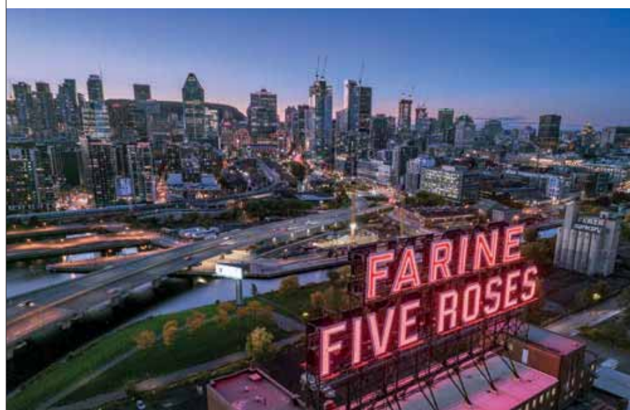
ESPECTACULAR CON HISTORIA. El horizonte de Montreal es uno de los más impresionantes del mundo. El anuncio de Farine Five Roses se erigió en 1948, y desde 2020 se le considera una obra arquitectónica protegida.

La ciudad ofrece un maravilloso crucero verde, que al mismo tiempo es una forma original de aprender más sobre los 150 años de historia del Canal Lachine.