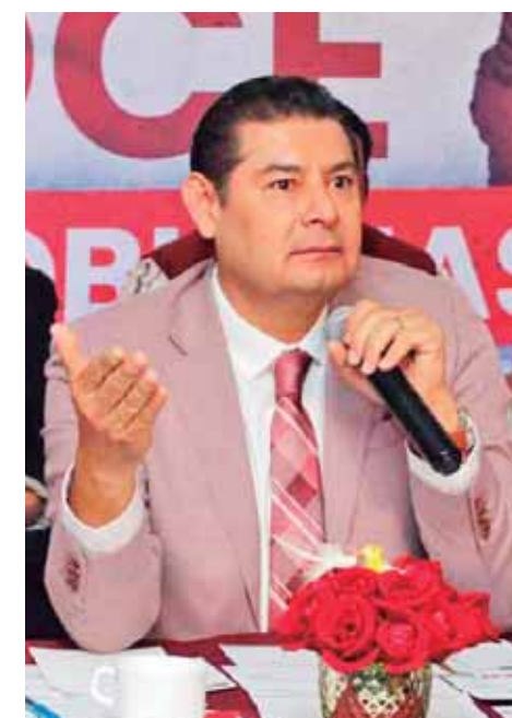
EL MILITANTE DEL PARTIDO MOVIMIENTO REGENERACIÓN NACIONAL (MORENA), SEÑALÓ QUE DURANTE 34 AÑOS DE VIDA PÚBLICA NUNCA HA PEDIDO A UNA CASA ENCUESTADORA QUE "CUCHARE, MODIFIQUE O ALTERE" UNA ENCUESTA PARA BENEFICIAR A ALGUIEN.

De las visitas de los aspirantes presidenciales que se vieron el fin de semana como Claudia Sheinbaum y Adán Augusto López, el morenista se limitó a reconocer que Puebla es importante en materia electoral.