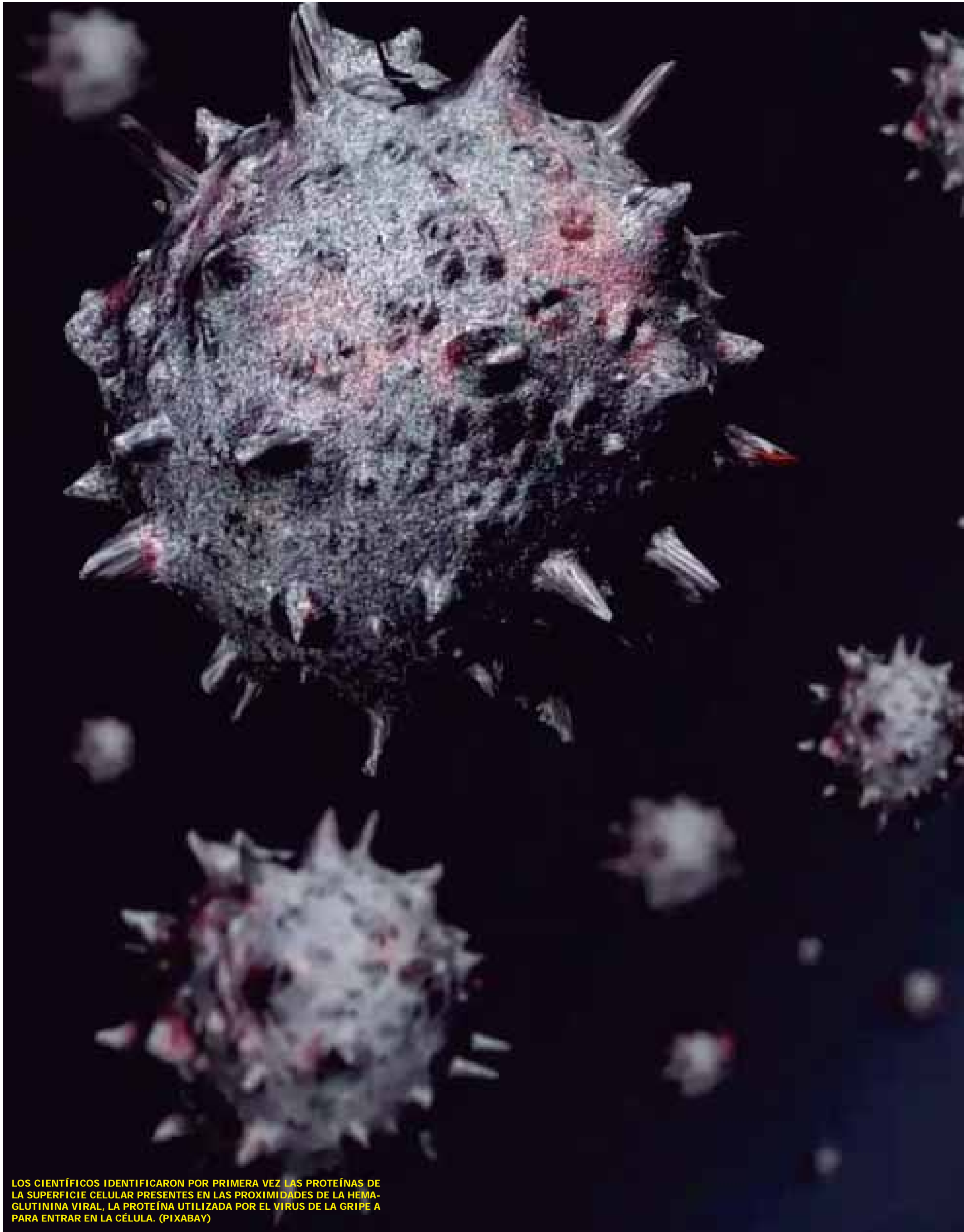
LOS CIENTÍFICOS IDENTIFICARON POR PRIMERA VEZ LAS PROTEÍNAS DE LA SUPERFICIE CELULAR PRESENTES EN LAS PROXIMIDADES DE LA HEMAGLUTININA VIRAL, LA PROTEÍNA UTILIZADA POR EL VIRUS DE LA GRIPE A PARA ENTRAR EN LA CÉLULA.