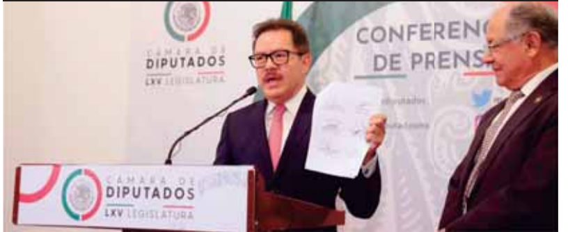
Anuncia Ignacio Mier acuerdo parlamentario para el avance de la Reforma sobre Justicia Electoral