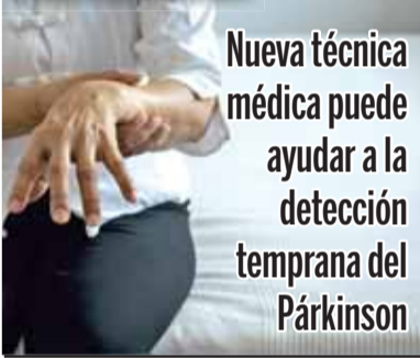
Nueva técnica médica puede ayudar a la detección temprana del Párkinson

Operaciones y viajeros, aumentan actividad de la terminal aérea de Huejotzingo