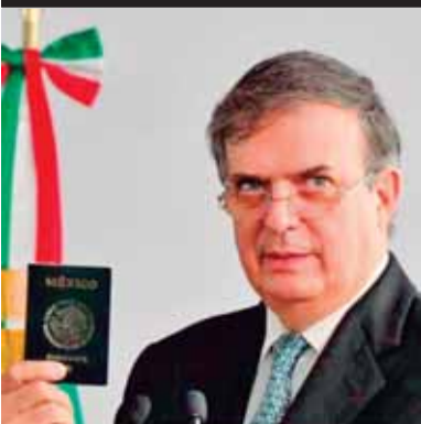
Ebrard inaugurará mañana la Oficina de Relaciones Exteriores en Tepeaca y de paso se promocionará

Estado contratará a empresa por 4 MDP para operar el retiro de espectaculares ilegales