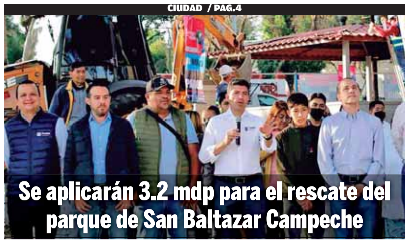
Se aplicarán 3.2 mdp para el rescate del parque de San Baltazar Campeche