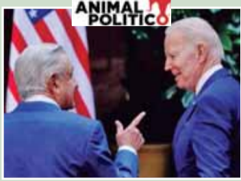
EU usó Pegasus para espiar objetivos en México: NYT

Newsweek Científicas unidas para demostrar el trato desigual