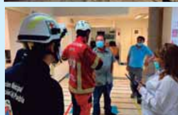
Protección Civil Municipal activó los protocolos correspondientes; no se reportan daños a inmuebles en el municipio