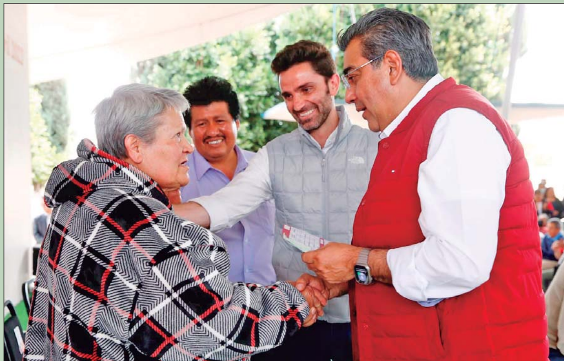
● SAN MATÍAS TLALANCALECA, Pue. El gobernador Sergio Salomón al presidir la entrega de beneficios del segundo Operativo de Pago Bienestar Bimestre Marzo-Abril 2023.

BAJO LOS PRINCIPIOS DE LA 4T, EL GOBIERNO DE PUEBLA TRABAJA POR EL BIENESTAR DE LOS MUNICIPIOS: SERGIO SALOMÓN