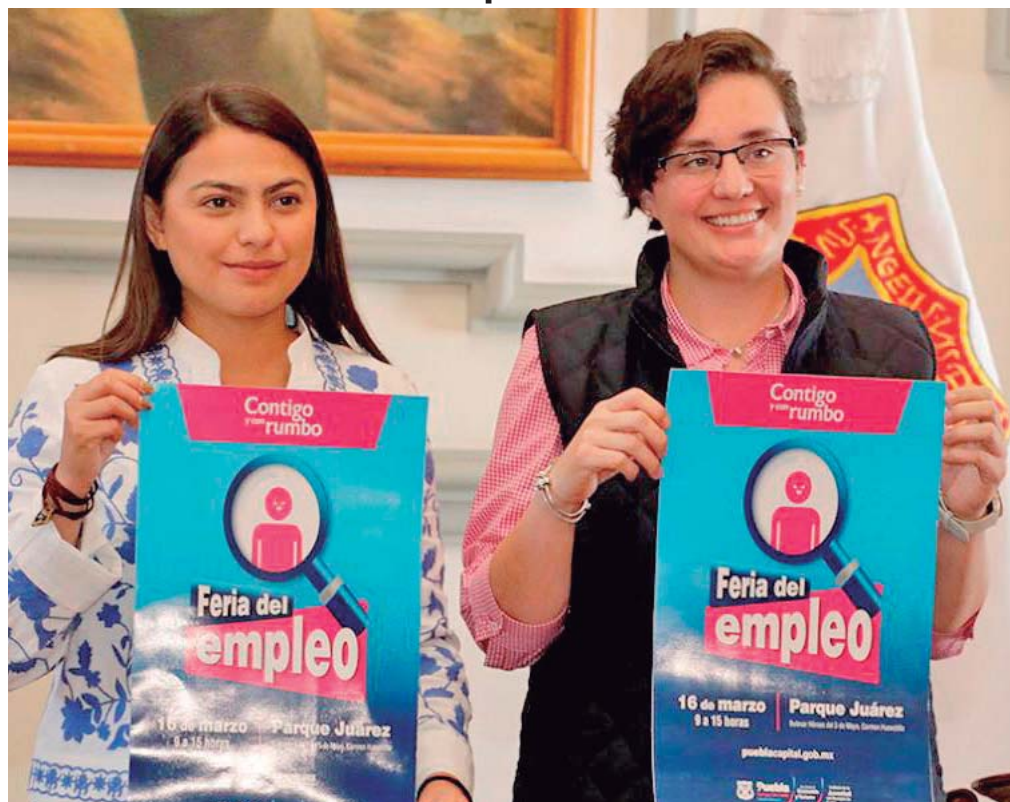
PARA ELLO HABRÁ UN PREREGISTRO A TRAVÉS DE LA PÁGINA DEL AYUNTAMIENTO, DANDO CLIC EN LA SECCIÓN DE FERIA DEL EMPLEO, O TAMBIÉN SE PODRÁ ACUDIR Y REGISTRARSE AL PARQUE JUÁREZ.