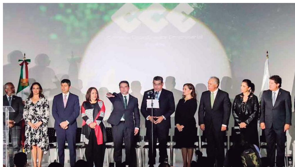
FUE EL GOBERNADOR DE PUEBLA, SERGIO SALOMÓN CÉSPEDES PEREGRINA, QUIEN MENCIONÓ QUE LA ADMINISTRACIÓN QUE ENCABEZA TENDRÁ LAS PUERTAS ABIERTAS, PARA TRABAJAR JUNTOS POR EL BIEN DE PUEBLA PARA LOGRAR INVERSIONES.