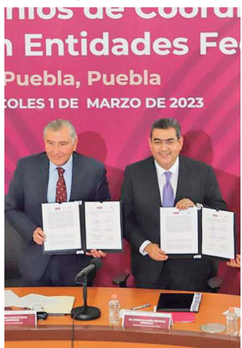
EL CONVENIO FUE FIRMADO POR CLAUDIA SHEINBAUM PARDO, JEFA DE GOBIERNO DE LA CIUDAD DE MÉXICO, ASÍ COMO LOS GOBERNADORES ALFREDO DEL MAZO MAZA, DEL ESTADO DE MÉXICO; MARÍA TERESA JIMÉNEZ ESQUIVEL, DE AGUASCALIENTES; INDIRA VIZCAÍNO SILVA, DE COLIMA; EVELYN SALGADO PINEDA, DE GUERRERO.

Puebla, Pue. El gobernador Sergio Salomón Céspedes Peregrina encabezó la Firma del Convenio de Colaboración en Materia de Seguridad con los Estados Limitrofes, y la Firma de Convenios de Coordinación del FASP 2023 con Entidades Federativas.