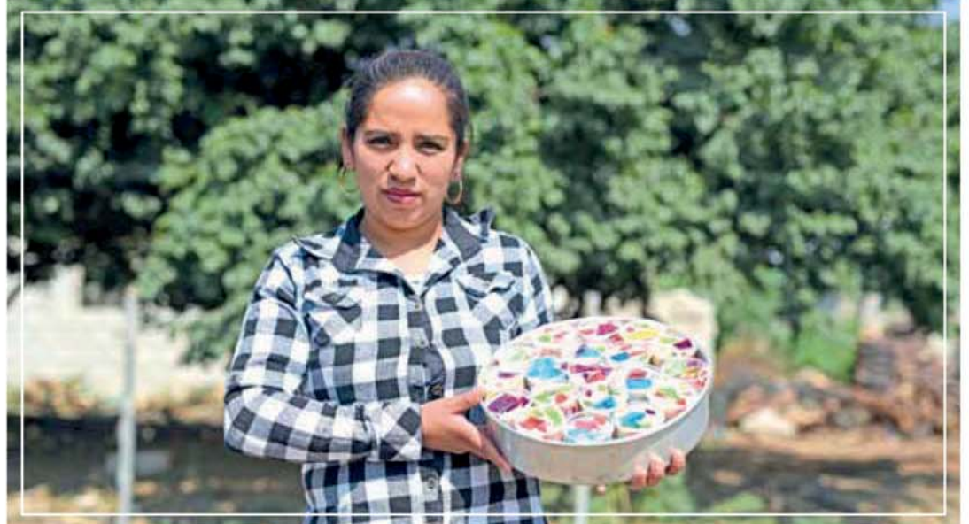
BENEFICIA GCM CON CURSOS A 1 MIL 100 PERSONAS EN 52 POBLACIONES