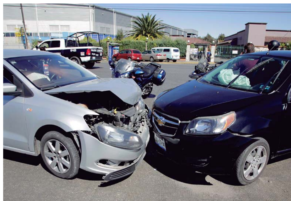
LA FUNCIONARIA MUNICIPAL EXPLICÓ QUE ENERO DEL 2023 CERRÓ CON 545 HECHOS DE TRÁNSITO, DONDE SE INCLUYEN 5 MUERTOS.

"Lamentamos profundamente, desde la Secretaría de Seguridad Ciudadana, la pérdida de 5 vidas humanas en enero del 2023, y para el corte del 14 de febrero de este año cerramos con