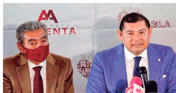
EL SENADOR POBLANO ALEJANDRO ARMENTA MIER.

Cabe hacer mención que este fin de semana, Claudia Rivera se reunió con la militancia del partido y el aspirante a la candidatura por Morena a la gubernatura de Puebla como Ignacio Mier Velazco, así como el aspirante a la presidencia de la República, Adán Augusto López y su líder nacional de partido, Mario Delgado.