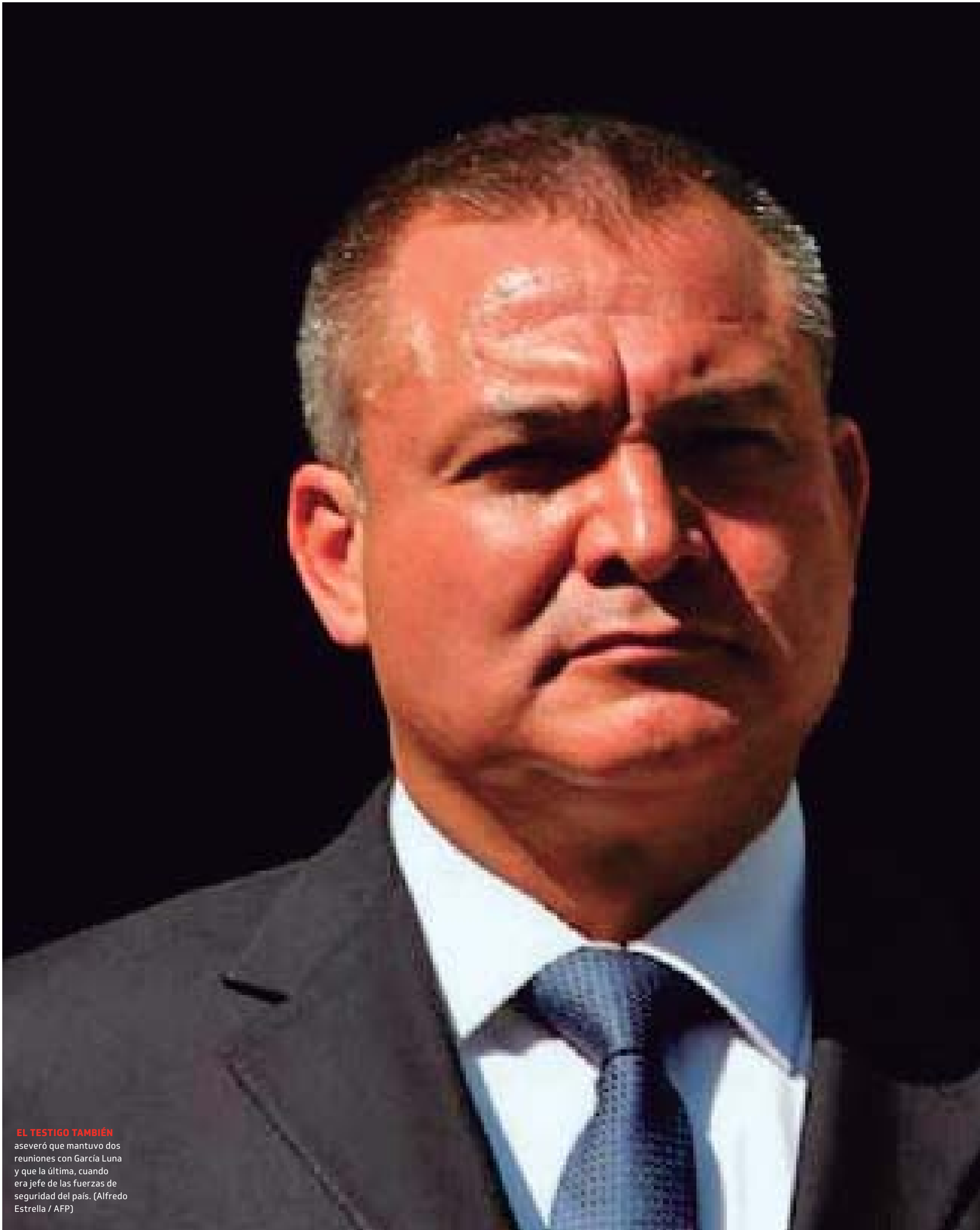
EL TESTIGO TAMBIÉN aseveró que mantuvo dos reuniones con García Luna y que la última, cuando era jefe de las fuerzas de seguridad del país.