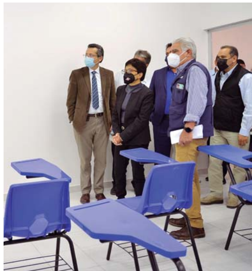
ESTAS ACCIONES FORMAN PARTE DE UNA REMODELACIÓN INTEGRAL QUE BENEFICIARÁ A UNA MATRÍCULA DE 9 MIL ESTUDIANTES DE SIETE PROGRAMAS EDUCATIVOS.

Estas acciones forman parte de una remodelación integral que beneficiará a una matrícula de 9 mil estudiantes de siete programas educativos. "Se hizo una remodelación y modernización. ● REDACCIÓN