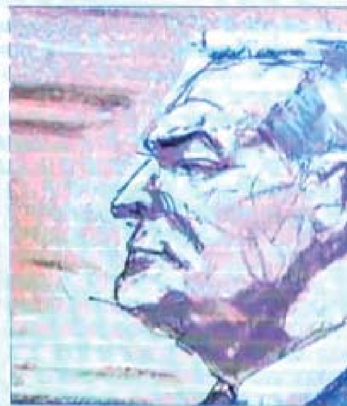
A. Juicio de Genaro García Luna. Ilustración de Jane Rosenberg.

El Grande subrayó que presentaba por lo menos 20 recibos en