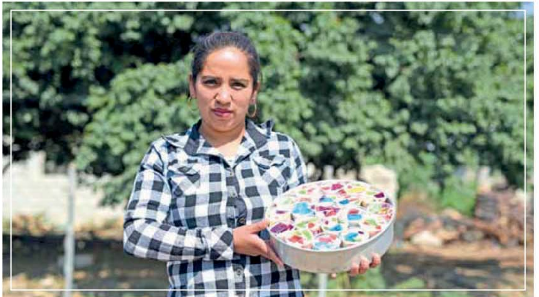
BENEFICIA GCM CON CURSOS A 1 MIL 100 PERSONAS EN 52 POBLACIONES