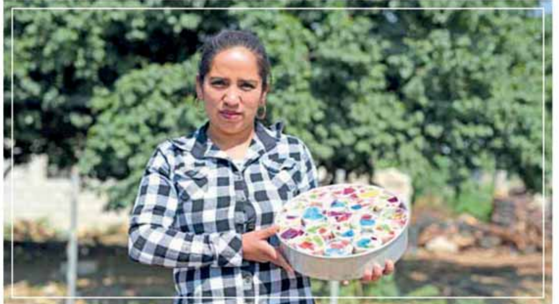
BENEFICIA GCM CON CURSOS A 1 MIL 100 PERSONAS EN 52 POBLACIONES