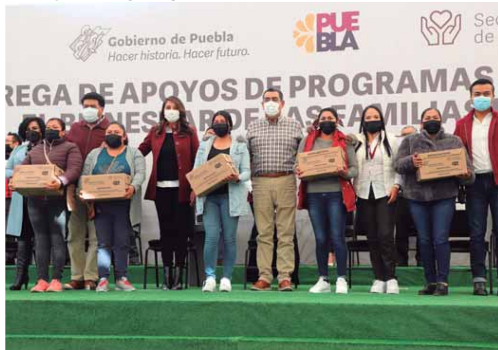
EN PUEBLA SIGUE FIRME LA VISIÓN DE MIGUEL BARBOSA HUERTA DE DEVOLVER EL RESPETO A LA DIGNIDAD DE LA GENTE.

● El mandatario presidió la entrega de apoyos para el bienestar en el municipio de Huejotzingo