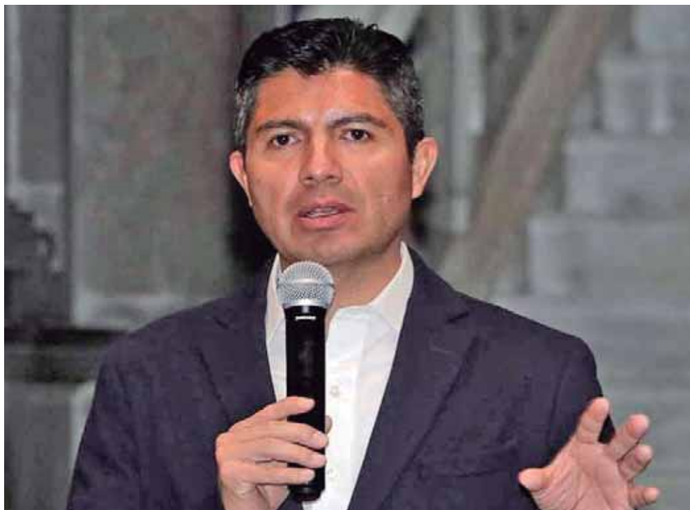
EL ALCALDE PIDIÓ A TODOS LOS ACTORES POLÍTICOS CONCENTRARSE EN LAS TAREAS QUE ACTUALMENTE DEBEN DESEMPEÑAR, Y TOMAR UNA POSTURA CUANDO EXISTA UNA DEFINICIÓN DE LA SITUACIÓN POLÍTICA.

"Creo que ahorita todos los actores, deberíamos que enfocarnos en nuestra responsabilidad, yo estoy enfocado en mi responsabilidad, trabajamos todos los días haciendo este tipo de trabajos, desde muy temprano hasta que anochece, yo estoy enfocado en que el rumbo de