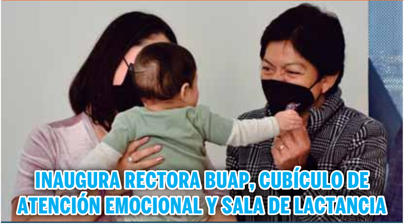
INAUGURA RECTORA BUAP, CUBÍCULO DE ATENCIÓN EMOCIONAL Y SALA DE LACTANCIA