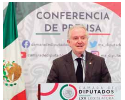
NO PODEMOS ACEPTAR QUE MÉXICO SE CONVIERTA EN EL "PATIO TRASERO" DE ESTADOS UNIDOS

En torno al reciente siniestro en el Sistema de Transporte Colectivo Metro, Creel Miranda se pronunció a favor de que retorne