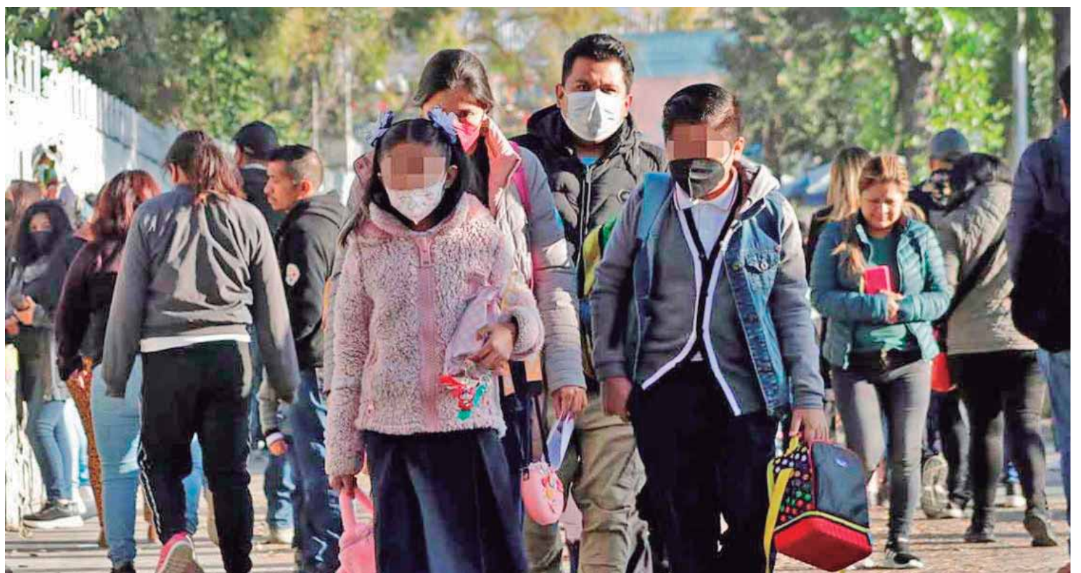
EL MUNICIPIO REPORTA BAJAS TEMPERATURAS Y LAS MADRES DE FAMILIA HAN OPTADO POR ABRIGAR A SUS HIJOS.