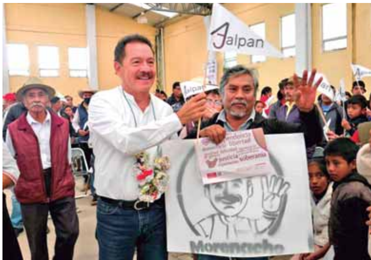
REGRESARÁ A LA SIERRA NEGRA CON FUNCIONARIOS FEDERALES PARA EVALUAR PROGRAMAS SOCIALES. ADELANTÓ QUE INVITARÁ AL GOBERNADOR DE PUEBLA.

Alcomunga.- La forma de transformar la realidad y mejorar las condiciones de vida de las comunidades indígenas es estando unidos, exigir mayores apoyos y quitarse el miedo ante las amenazas de quienes lucran con la pobreza, sentenció el coordina-