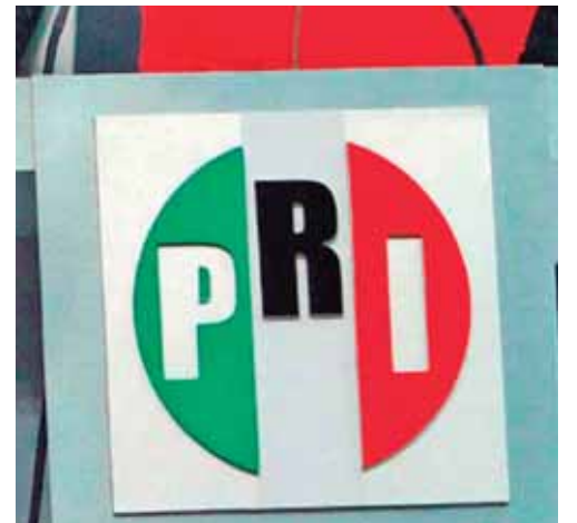
LO ANTERIOR FUE DADO A CONOCER POR LA EX PRIMERA PRESIDENTA MUNICIPAL DE PUEBLA CAPITAL, EN RUEDA DE PRENSA DONDE HABLÓ TAMBIÉN DEL TRABAJO QUE SE HA VENIDO REALIZADO EN LA CÁMARA DE DIPUTADOS.

“Voy a ser su aliado y mi máxima esperanza, juntos con ustedes, es construir una verdadera transformación en el estado de Puebla para el beneficio de todos los poblanos”. ● REDACCIÓN