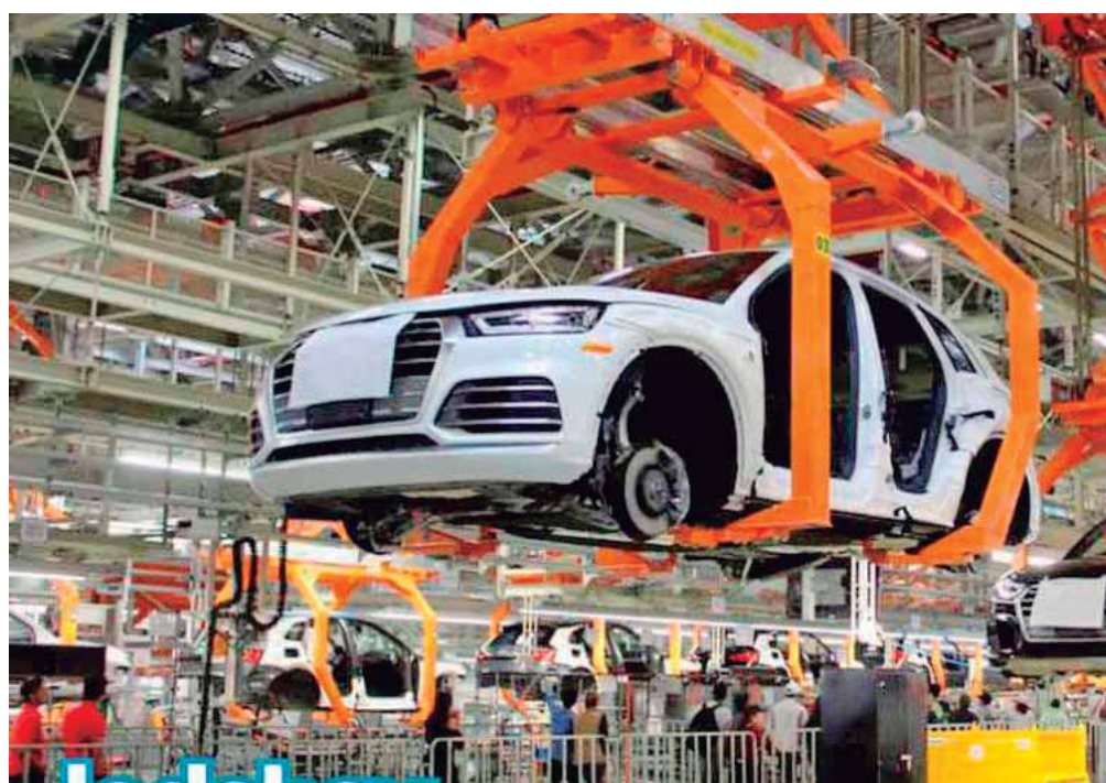
RECORDEMOS QUE EL PASADO 16 DE DICIEMBRE, 3 MIL 604, TRABAJADORES DE SITAUDI VOTARON EN CONTRA DE LAS DOS PROPUESTAS DEL INCREMENTO SALARIAL DEL 8.4 POR CIENTO QUE APLICARÍA A PARTIR DE ENERO DE 2023, ASÍ COMO DE LA PROPUESTA DEL INCREMENTO MULTIANUAL.

"La empresa hasta el momento solo ofrece un aumento a los salarios del 8.4 por ciento algo en lo que no estamos de acuerdo puesto que el poder adquisitivo