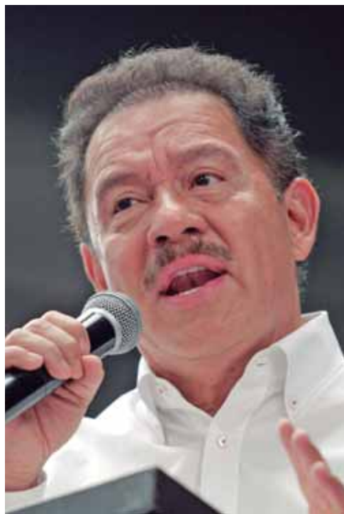
ESTIMA QUE LA PROPUESTA DE REFORMA ELECTORAL, QUE SE ELABORA CON LA PARTICIPACIÓN DE LA MAYORÍA DE LOS PARTIDOS POLÍTICOS EN LA CÁMARA DE DIPUTADOS, PUEDE QUEDAR LISTA LA PRIMERA SEMANA DE DICIEMBRE

Mier Velazco señaló que en años anteriores hubo gobiernos que convirtieron al Estado mexicano en un modelo