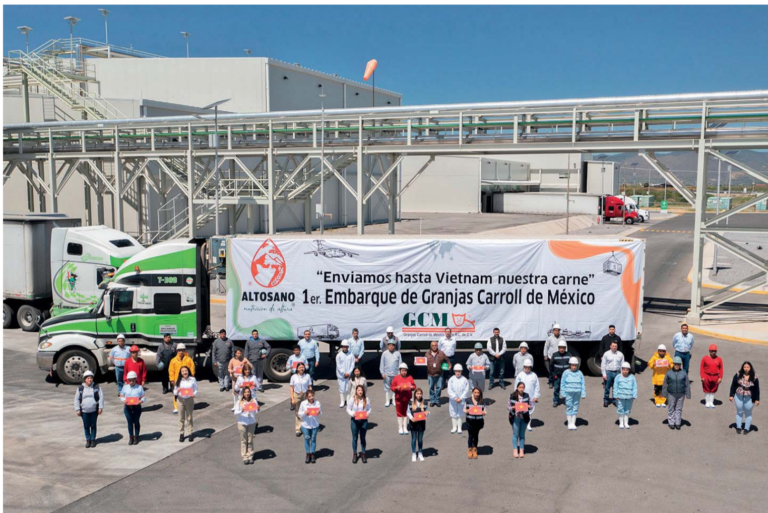
SE TRATA DE UN PRIMER ENVÍO CON 22 MIL KILOGRAMOS DE DIFERENTES PRODUCTOS DE CERDO DE LA MARCA DE GRANJAS CARROLL DENOMINADA "ALTOSANO".