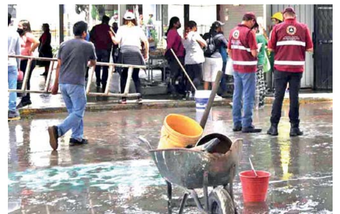
SEIS ESCUELAS MANTIENEN DAÑOS EN LAS ÚLTIMAS SEMANAS POR CAUSA DE LAS LLUVIAS.