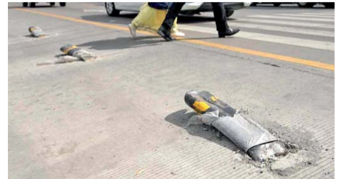
TODOS LOS BOLARDOS QUE ESTABAN EN EL EXESTACIONAMIENTO URBAN BICI, TAMBIÉN SE VAN A DESINSTALAR, YA QUE, ESTOS DEJARON DE SER ÚTILES, NO OBTANTE, LOS QUE TENGAN BUENAS CONDICIONES SERÁN COLOCADOS EN OTROS PUNTOS DE LA CIUDAD DE PUEBLA.

"El área de maquinaria de la Secretaría de Movilidad e Infraestructura, ya está haciendo este trabajo, pues esperaríamos que a finales de noviembre o diciembre, ya tengamos el rito, son aproximadamente 200 daños de manera general", declaró. ● SILVINO CUATE