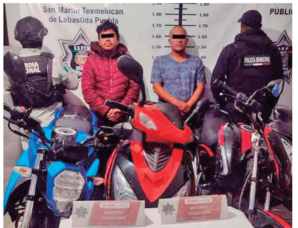
LA POLICÍA DE TEXMELUCAN Y LA GUARDIA NACIONAL DETUVIERON EN MOYOTZINGO A DOS PRESUNTOS LADRONES QUE OPERABAN A TRAVÉS DE FACEBOOK.

Tras ser asaltados, las víctimas pidieron el apoyo de la policía quienes junto