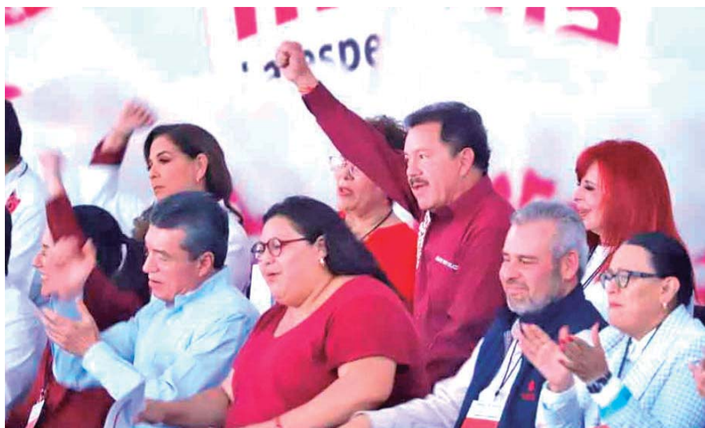
IGNACIO MIER ENFATIZÓ QUE LA PROPUESTA DE LA GN SÓLO TIENE EL PROPÓSITO DE FORTALECER LA SEGURIDAD PÚBLICA EN ESTADOS Y MUNICIPIOS, DE AHÍ LA IMPORTANCIA DE DAR CONTINUIDAD A ESTE PROCESO DE REFORMA.

Puebla, Pue. El coordinador de los diputados federales en la Cámara de Diputados, Ignacio Mier Velazco, confirmó que Morena estará consolidado como partido para las elecciones del 2023 y 2024.