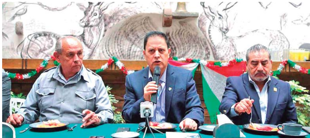
CON DICHA ACCIÓN SE VULNERA DE MANERA FLAGRANTE LOS DERECHOS HUMANOS, DE LOS ESTUDIANTES Y OBSTACULIZANDO SU INCURSIÓN AL MERCADO LABORAL.