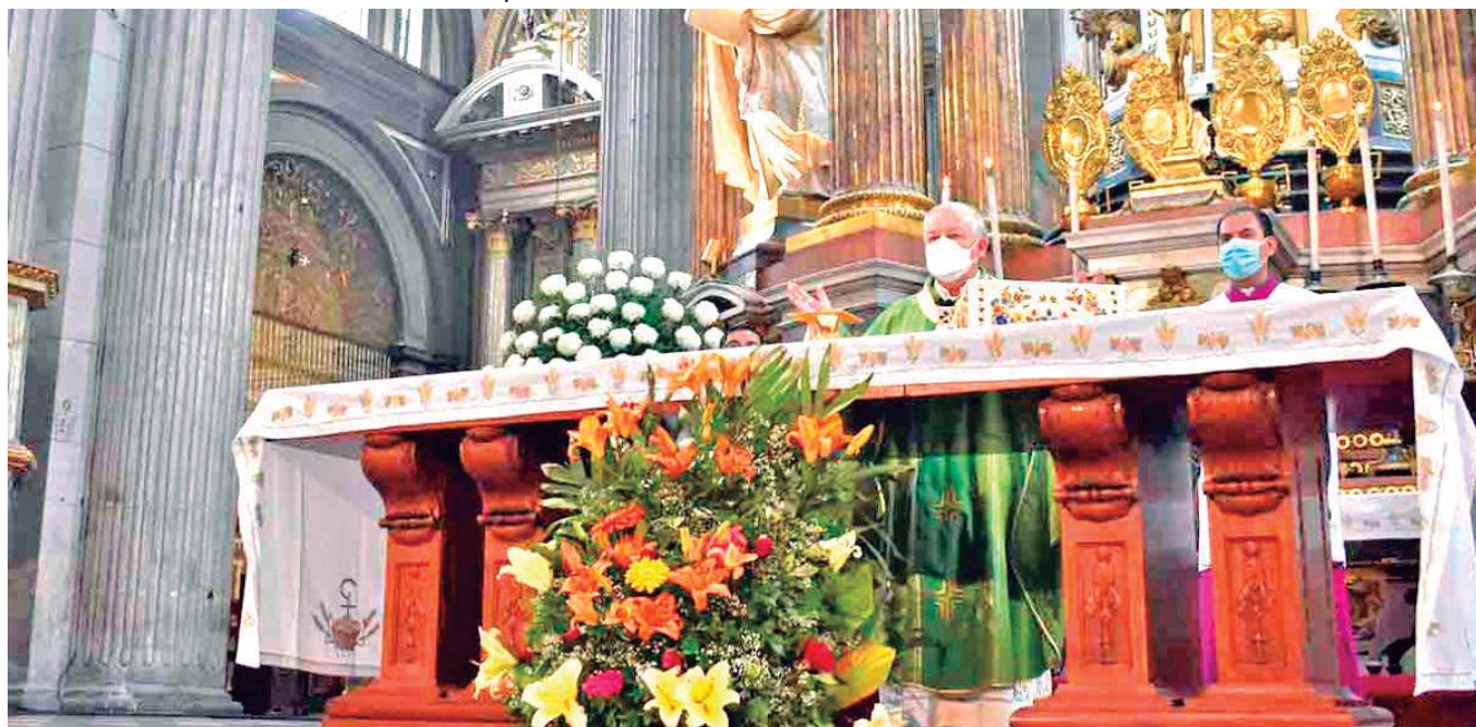
EL ARZOBISPO DE PUEBLA, VÍCTOR SÁNCHEZ ESPINOSA, DURANTE LA MISA TRADICIONAL DESDE LA CATEDRAL ANGELOPOLITANA.

Finalmente, para la región 155 que contempla 63 municipios, como Acajete, Acatzingo, Cuapiaxtla, Huehuetlán el Grande, Mazapiltepec, Quecholac, Tecali y Tehuacán, entre otros, el costo del gas LP está en 21.91 pesos por kilo. ● ALMA MÉNDEZ