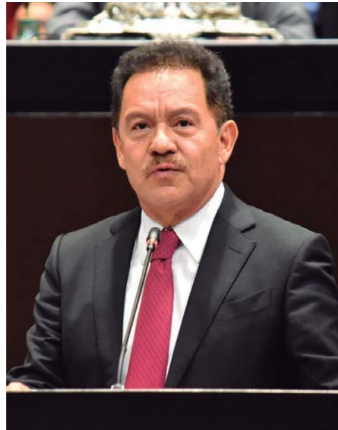
HACE UN LLAMADO A LAS Y LOS GOBERNADORES DE LA OPOSICIÓN PARA QUE LES PIDAN A SUS REPRESENTANTES EN LA CÁMARA DE DIPUTADOS QUE VOTEN A FAVOR DE ESTA PROPUESTA.

Agregó que al igual que todos los ciudadanos, los elementos de la Guardia Nacional tienen derecho a la seguridad social y a que su salario esté garantizado, sus ascensos, su promoción. Por ello, expresó que la propuesta proveniente de la bancada del PRI abre la posibilidad de re-