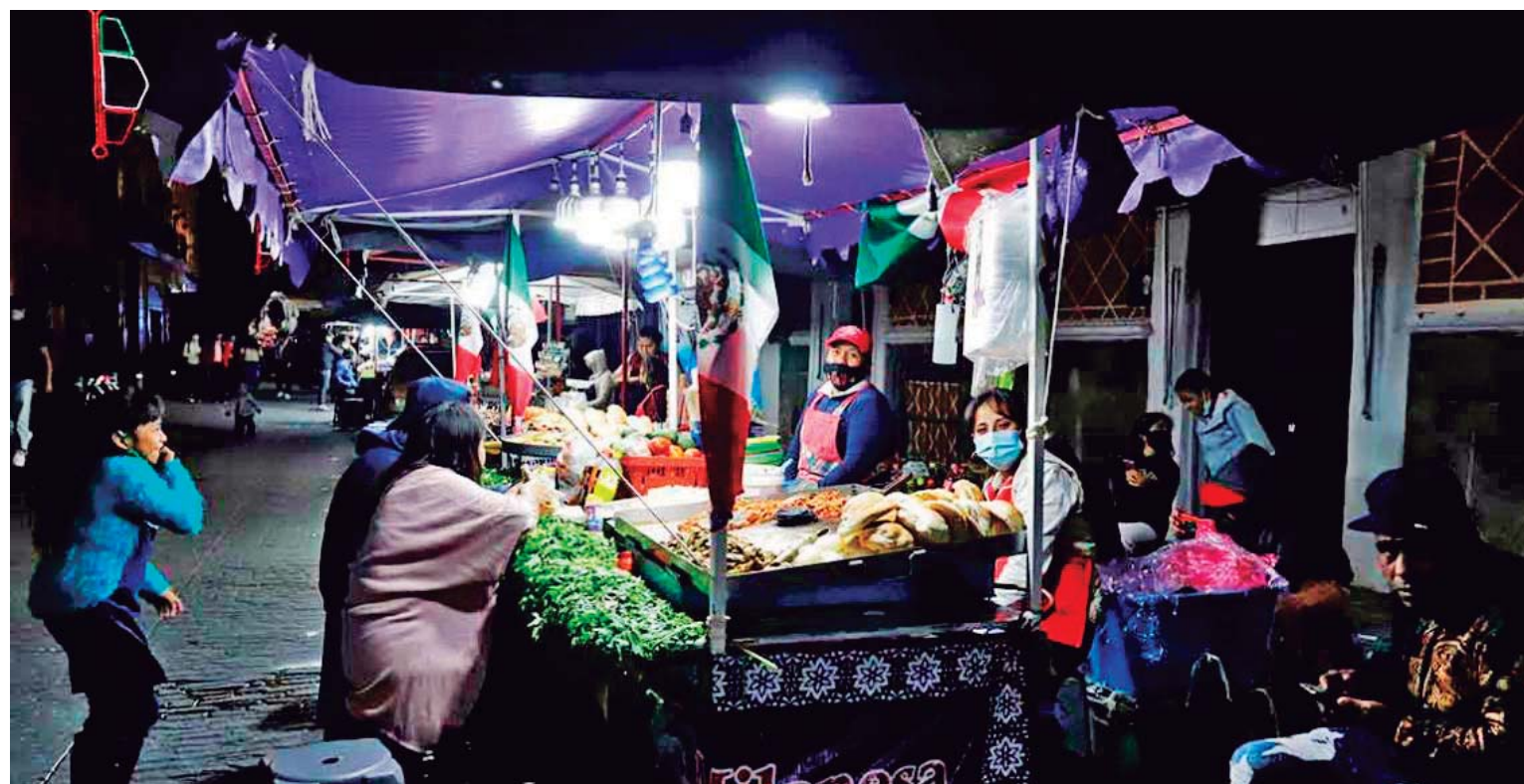
SIGUEN LAS REUNIONES CON EL GOBIERNO DEL ESTADO DE PUEBLA, PARA TERMINAR DE CONCLUIR LA LOGÍSTICA DE CELEBRACIÓN QUE SE ESTARÁN REALIZANDO EN EL MES DE SEPTIEMBRE.

"Por primera vez en la historia de la Ciudad que nos vamos a anticipar con las fiestas patrias, estaremos haciendo la inauguración el próximo 28 de agosto", dijo. ● SILVINO CUATE