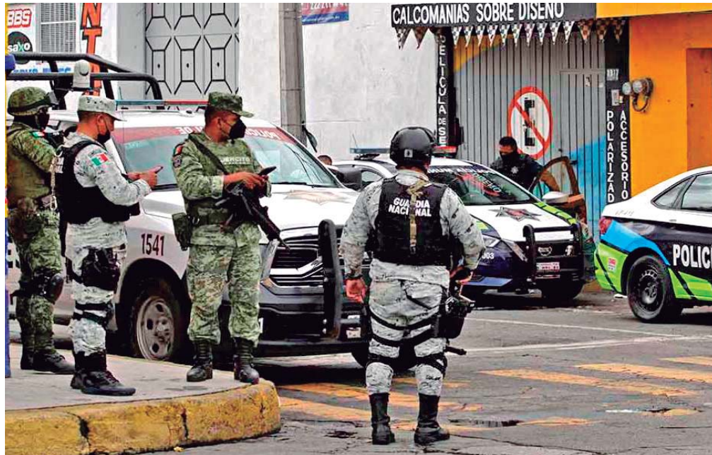
POR ESTOS OPERATIVOS, SE TUVIERON QUE CERRAR LAS CALLES 42, 44 Y 46 PONIENTE, ADEMÁS DE LA DIAGONAL DEFENSORES DE LA REPÚBLICA, LA 11 NORTE, 21 SUR Y 50 PONIENTE, PARA EVITAR QUE ALGUIEN INTENTE INGRESAR.

Puebla, Pue. A pesar de que los comerciantes de la 46 Poniente se han mostrado inconformes con los operativos para decomisar presuntas piezas ilegales, esta zona, al igual que la Cuchilla, se va a limpiar, según lo advirtió el gobernador Miguel Barbosa Huerta.