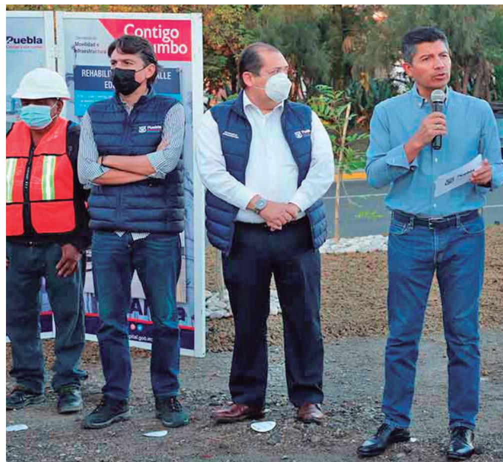
ESTA OBRA ABARCA, DESDE EL ACCESO DE AMOZOC, HASTA MERCADO MORELOS, PASANDO POR EL CAMPANARIO Y LA 44 PONIENTE, POR ELLO, LA OBRA BENEFICIA A MÁS DE 80 MIL PERSONAS EN LA ZONA Y MÁS DE 6 COLONIAS.

Aseguró que todos los recursos que entran a la tesorería municipal, son destinadas para mayores beneficios de los poblanos, como lo son la adquisición de patrullas, reparación de luminarias, y calles.