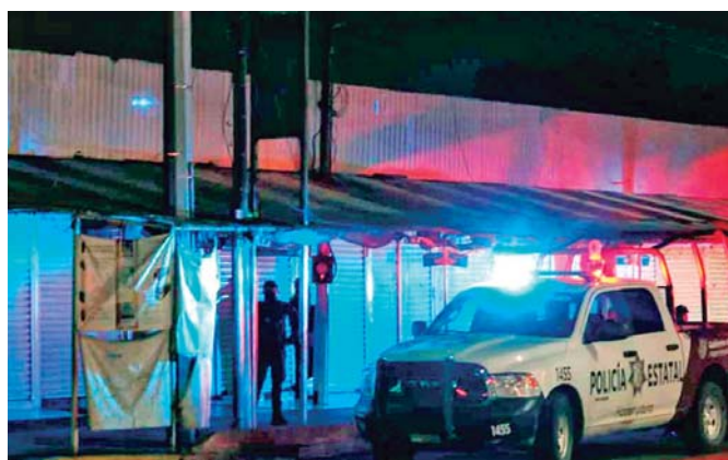
DURANTE RUEDA DE PRENSA DENUNCIARON QUE TORTURARON A SIETE LOCATARIOS Y SUBIERON A UNA CAMIONETA, PARA DESPUÉS DEJARLOS EN UNOS TERRENOS BALDÍOS; ADEMÁS LOS AMENAZARON CON QUE NO DIJERAN NADA, PORQUE HABRÍA CONSECUENCIAS.

“Yo te puedo decir que no se vale, si vienen a hacer cateos que los hagan, pero no se vale, meter miedo, ni tampoco decir que somos criminales, muchos de los que estamos aquí vivimos al día, si no trabajamos no llevamos dinero a nuestras casas, a nuestros hijos, no se vale decir que somos criminales, no lo somos”, finalizó. ● ALMA MÉNDEZ