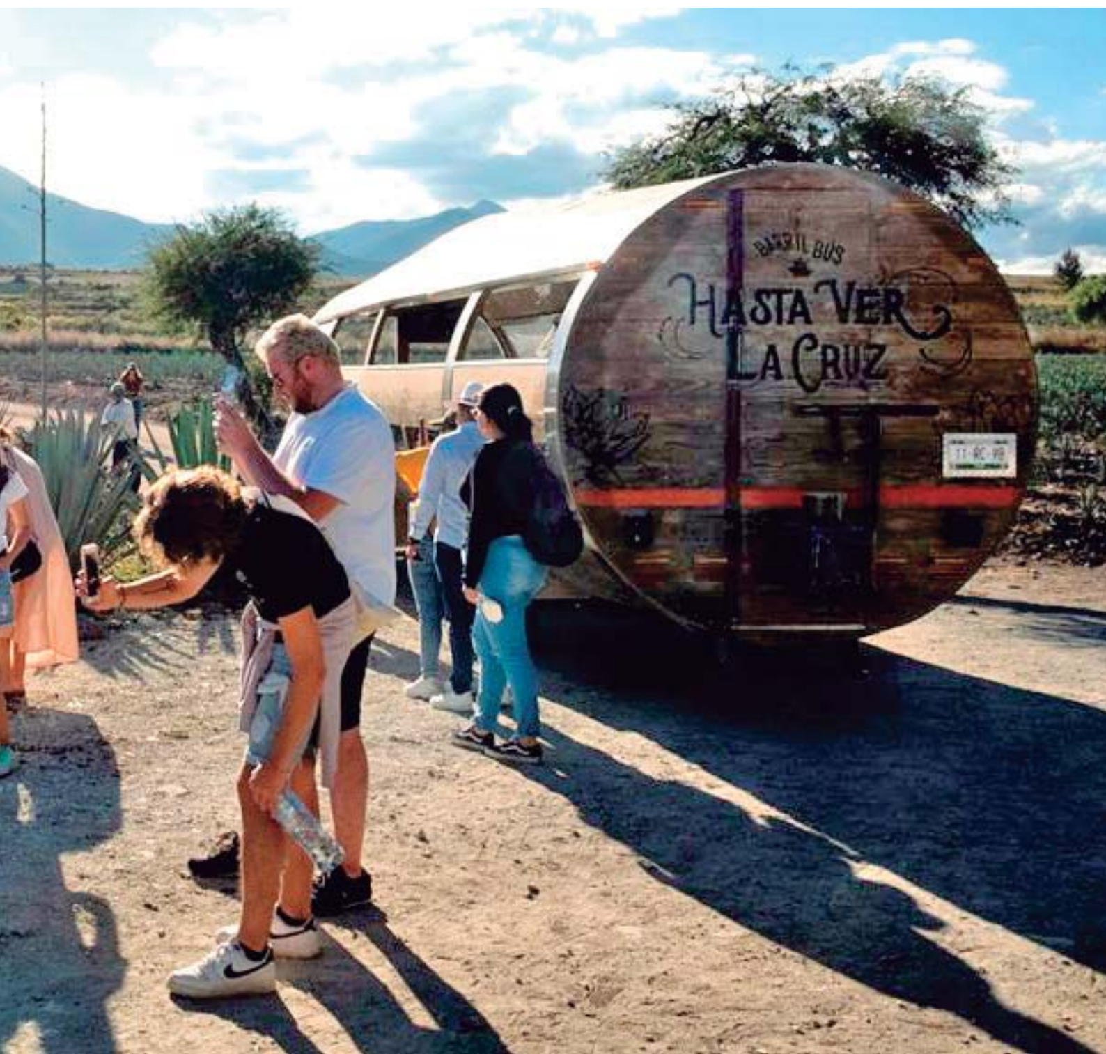
EN ALGUNOS DE LOS PUEBLOS, COMO EL AYUUK, EN LA REGIÓN MIXE DE OAXACA, ANTES DEL PRIMER SORBO DE MEZCAL SE VIERTE UN CHORRO A LA TIERRA, COMO MUESTRA DE RESPETO, Y DESPUÉS SE DEGUSTA Y SE COMPARTE CON AMIGOS Y FAMILIARES.

ven en situaciones muy complejas. Es muy triste ver que la gente que produce el agave y lo destila sigue igual que siempre porque no les pagan lo justo. Eso es una pena porque Oaxaca se esclavizó con el mezcal. Los productores son explotados para beneficiar a otros”.