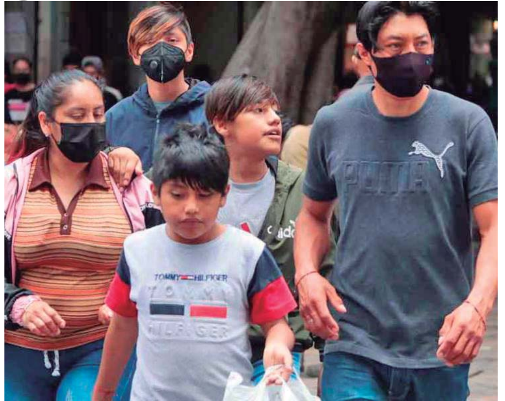
DIPUTADOS QUE FORMAN PARTE DE LAS COMISIONES UNIDAS DE PROCURACIÓN Y ADMINISTRACIÓN DE JUSTICIA, IGUALDAD DE GÉNERO Y FAMILIA, APROBARON POR UNANIMIDAD EL DICTAMEN QUE SERÁ PRESENTADO ANTE EL PLENO DEL CONGRESO LOCAL ESTE VIERNES 14 DE JULIO PARA SU APROBACIÓN FINAL.

Con la cual a partir de su aprobación en este dictamen ya se reconoce la violencia vicaria como "todo acto o comisión intencional con el objeto de castigar o causar daño a la víctima a través del perjuicio, maltrato, descuido y/o manipulación de las hijas, hijos o vínculo filial con