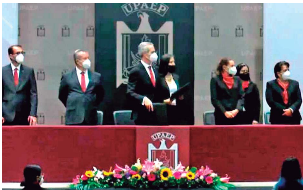
AYER MARTES, SE REALIZÓ LA CEREMONIA DE OTORGAMIENTO DE GRADO DE LAS PREPAS CHOLULA, SANTA ANA Y SUR UPAEP, DONDE SE ENFATIZÓ LA CONSTANCIA Y DEDICACIÓN, LAS DOS CARACTERÍSTICAS QUE ESTÁN PRESENTES EN UN LÍDER TRANSFORMADOR.