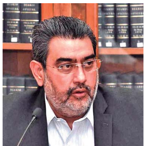
EL PRESIDENTE DEL CONGRESO LOCAL, SERGIO SALOMÓN CÉSPEDES PEREGRINA.

Puebla, Pue. El presidente del Congreso local, Sergio Salomón Céspedes Peregrina es el primero en confirmar de manera oficial que estará buscando el respaldo de su partido Morena para postularse como candidato a la gubernatura de Puebla en los comicios del 2024.