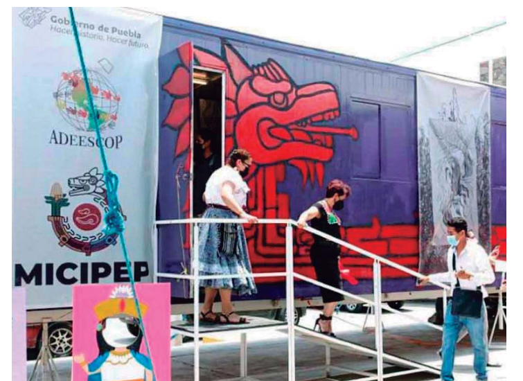
EN MEDIO DE BAILES Y EXPOSICIONES, FUE PRESENTADO EL MUSEO, QUE RECORRERÁ DIFERENTES REGIONES DE LA ENTIDAD, A FIN DE FORTALECER EL CONOCIMIENTO SOBRE LAS RAÍCES QUE CONSTITUYERON LA CULTURA DE POBLANAS Y POBLANOS.