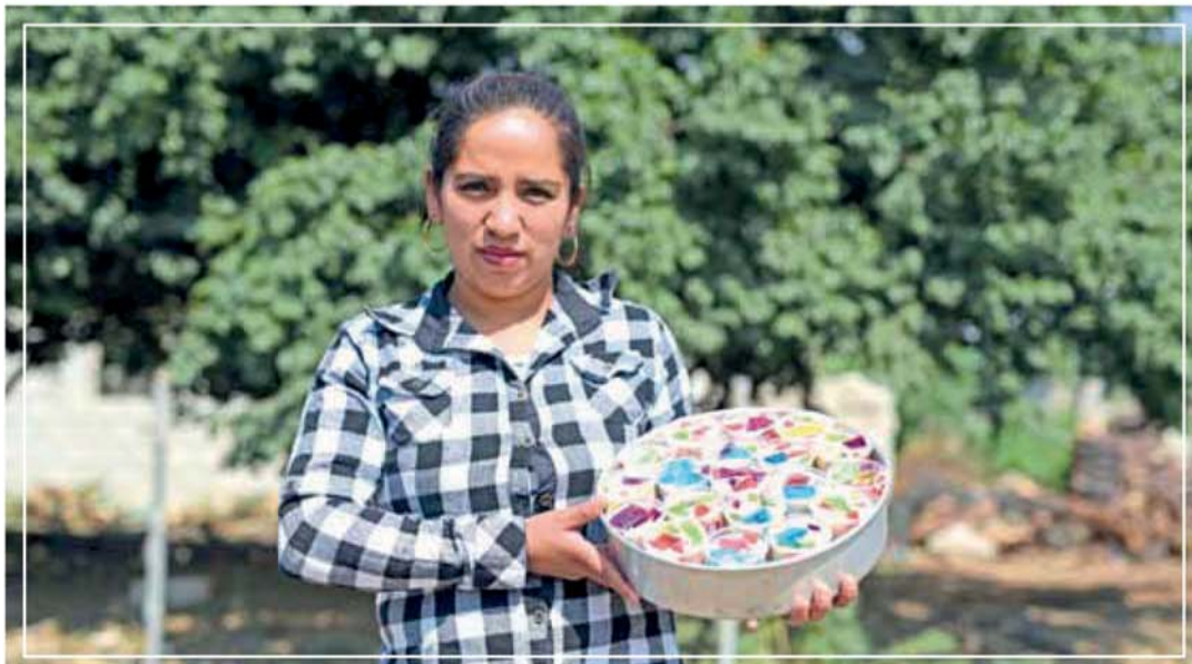
BENEFICIA GCM CON CURSOS A 1 MIL 100 PERSONAS EN 52 POBLACIONES