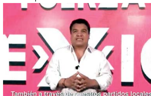
También a través de nuestros partidos locales

El INE ordenó en días pasados que el ex diputado local regrese la suma de 33.9 millones de pesos ante un aparente desvío de recursos, y por lo cual se estaría actuando de manera legal contra el también ex secretario de Desarrollo Social, y quién por su paso en esta dependencia de gobierno fue señalado de no haber transparentando la entrega de apoyos para las comunidades afectadas por el sismo del 19 de Septiembre del 2017. ● REDACCIÓN