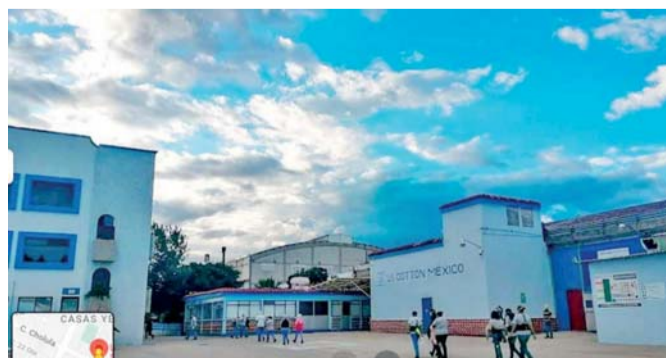
LOS QUEJOSOS MENCIONARON QUE CERCA DE 370 PERSONAS LABORAN EN ESTA EMPRESA, A LOS CUALES LES AFECTARÁ YA QUE ESPERABAN DICHA PRESTACIÓN.