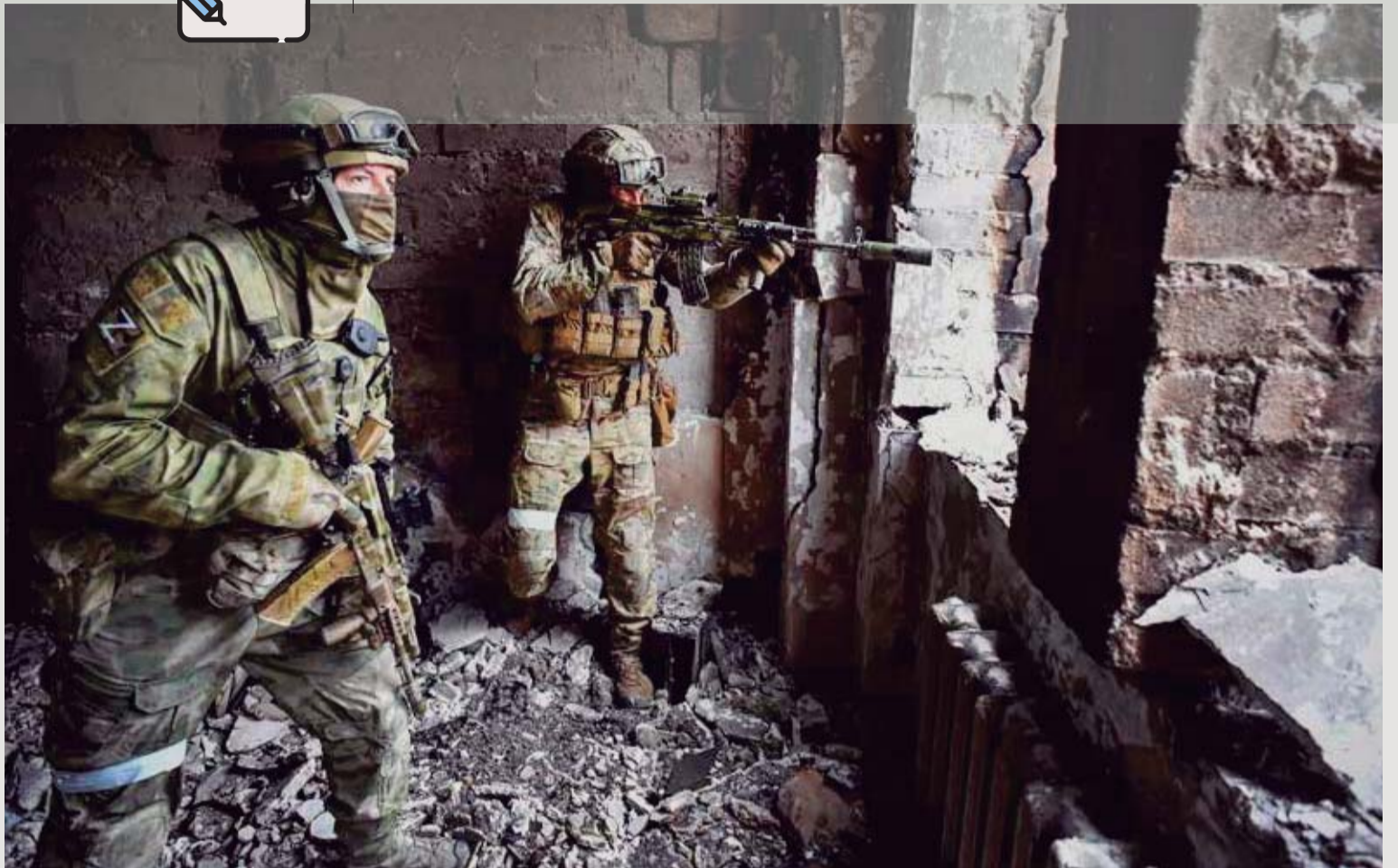
SOLDADOS RUSOS patrullan Mariúpol en Ucrania, el 12 de abril de 2022.

» Nunca hemos tenido a nuestro alcance la verdad de las guerras, solo somos rehenes de los intereses de quienes se involucran en ellas”.