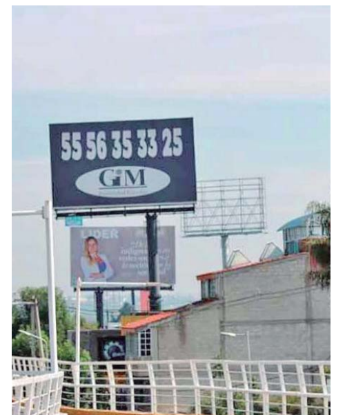
LAS INCONSISTENCIAS QUE SE DETECTARON ES QUE NO HICIERON LOS TRÁMITES ANTE EL AYUNTAMIENTO, MIENTRAS QUE OTROS LO REALIZARON, PERO NO LO ACABARON.