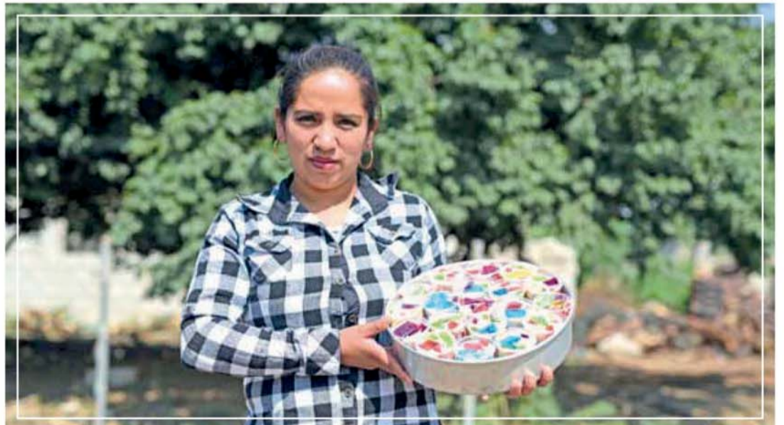
BENEFICIA GCM CON CURSOS A 1 MIL 100 PERSONAS EN 52 POBLACIONES