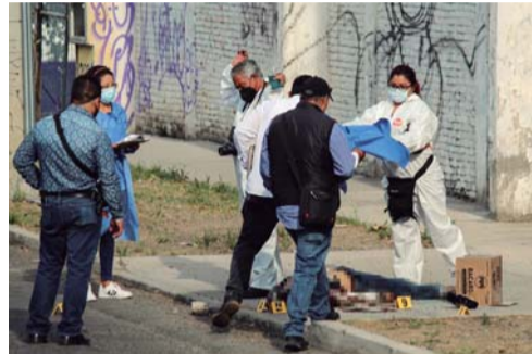
UN MILITAR RETIRADO MATÓ A UNO DE LOS LADRONES CUANDO INTENTARON ASALTARLO Y ROBARLE LA UNIDAD EN SAN ANDRÉS CHOLULA.

Mientras tanto el militar fue trasladado