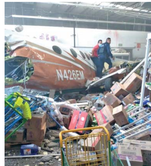
ENTRE LOS FALLECIDOS SE ENCUENTRA ALEJANDRA 'N', DE 46 AÑOS, ESPOSA DEL EMPRESARIO POBLANO, SALVADOR ECHEGUREN.

La falta de gasolina es una de las posibles causas que se investigan tras el fatídico accidente"