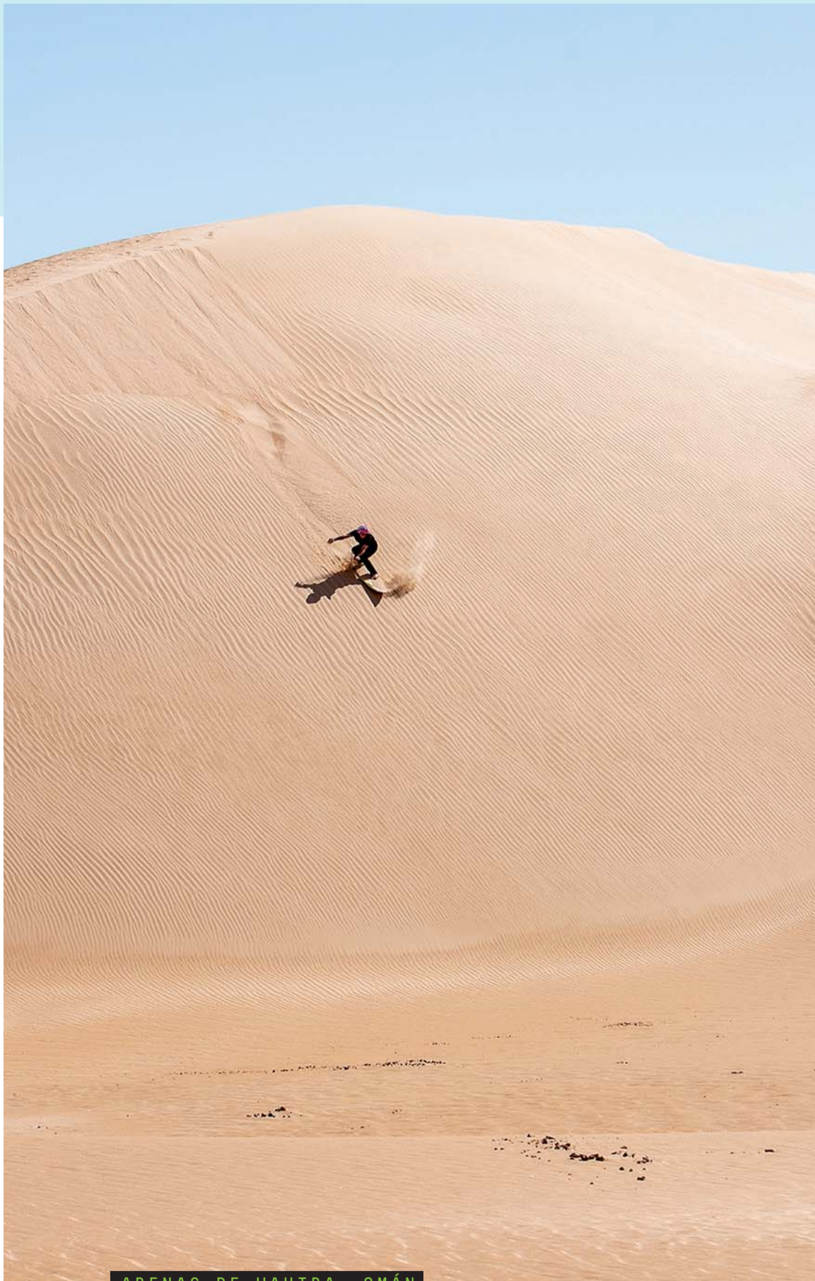
ARENAS DE WAHIBA, OMÁN