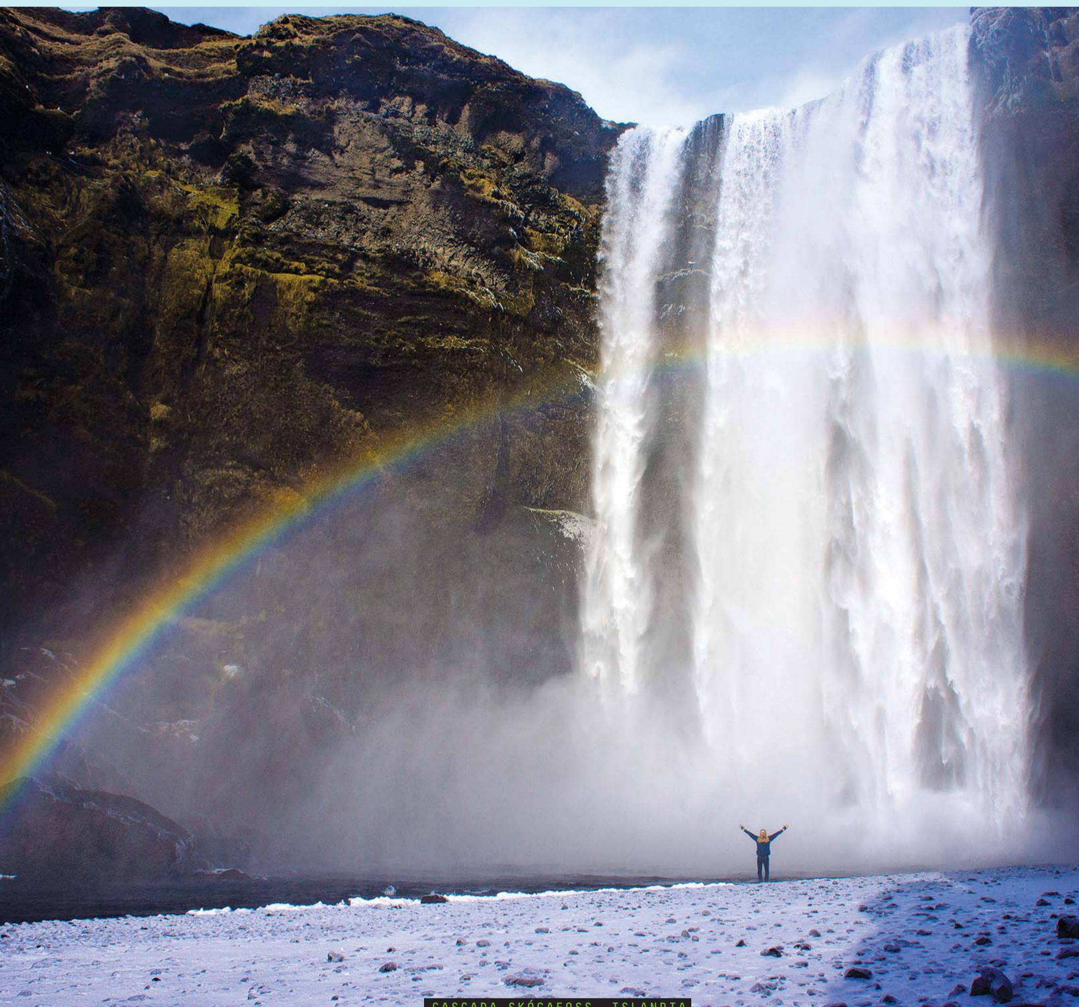
CASCADA SKÓGAFOSS, ISLANDIA