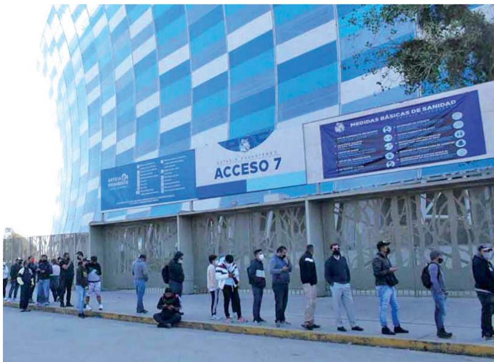
CRITICÓ QUE EMPRESARIOS DE ESTE RUBRO BUSCAN TENER MÁS RECURSO, ES POR ELLO QUE NO DAN DE ALTA A SUS COLABORADORES ANTE EL IMSS, POR EL ALTO COSTO QUE LES GENERA.

Puebla, Pue.- La Red Mexicana de Franquicias (RMF), sugirió que las empresas de seguridad privada sean regularizadas, supervisadas y auditadas, para evitar que se repitan casos como el del pasado fin de semana en el encuentro de fútbol entre Querétaro y Atlas.