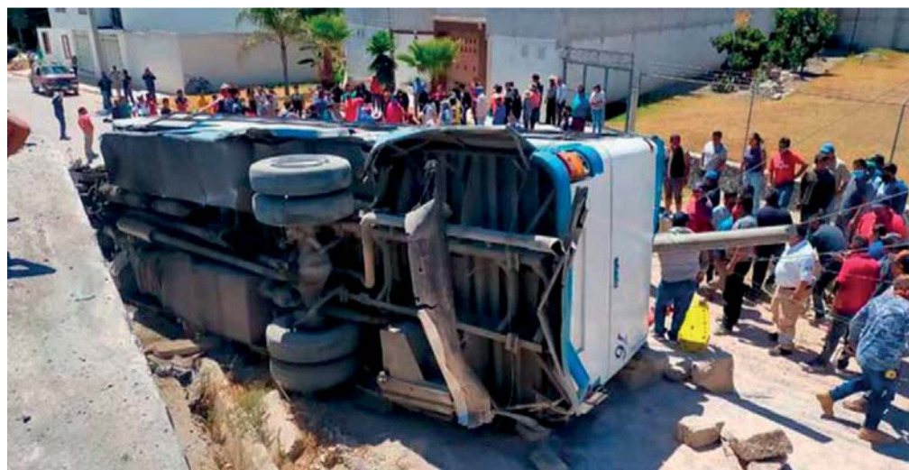
La volcadura del microbús de la ruta Acatzingo-Tepeaca se registró a la altura de San Hipólito