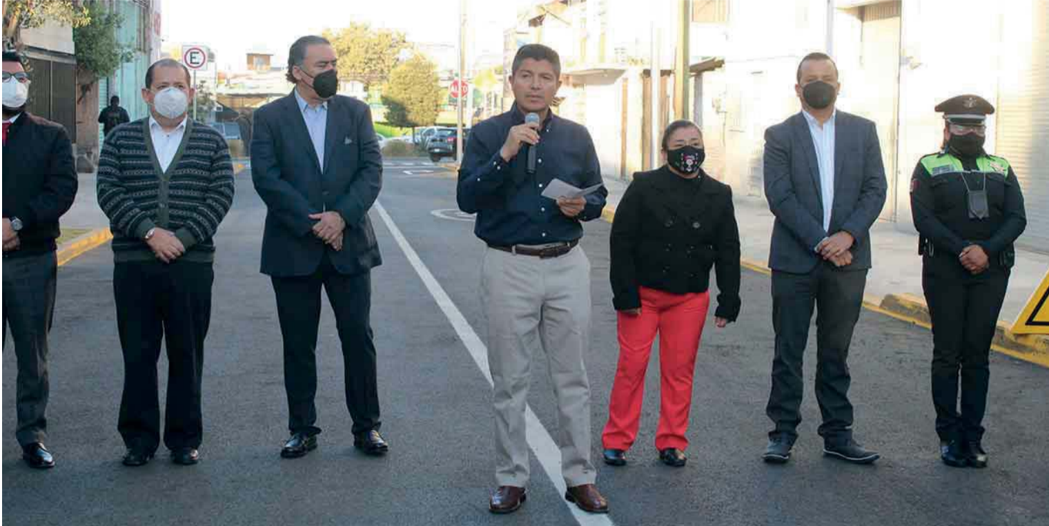
EL PRESIDENTE, EDUARDO RIVERA DURANTE LA SUPERVISIÓN DE LA CALLE COLIMA EN LA COLONIA SAN RAFAEL PONIENTE.

Puebla, Pue. Tendrá que ser el Distrito Electoral 09 el que resuelva si el alcalde de Puebla, Eduardo Rivera Pérez violó o no la veda electoral producto del ejercicio que se tendrá por la revocación de mandato, de ser que sí, el caso será remitido a la Sala Regional del Tribunal Electoral del Poder Judicial de la Federación para que imponga algún tipo de sanción.