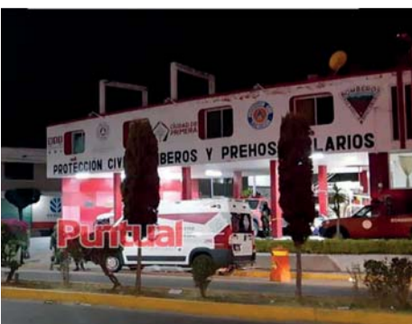
EL SUJETO IBA ACOMPAÑADO DE SU NOVIA, QUIEN TAMBIÉN RECIBIÓ UN DISPARO EN LA PIERNA.

Por último, la Fiscalía General del Estado (FGE) de Puebla arribó al Hospital para realizar las diligencias correspondientes para el levantamiento del cadáver. ● REDACCIÓN