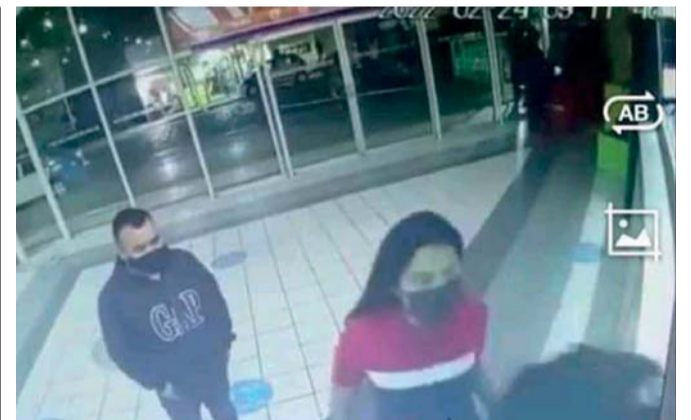
JAZUNI DE 13 AÑOS DE EDAD FUE VISTA COMPRANDO DOS BOLETOS EN LA TERMINAL DE AUTOBUSES DE TEHUACÁN EN COMPAÑÍA DE UN HOMBRE.

Sin lugar a dudas era una manifestación de fe que atraía también a diversos medios de comunicación. ● REDACCIÓN