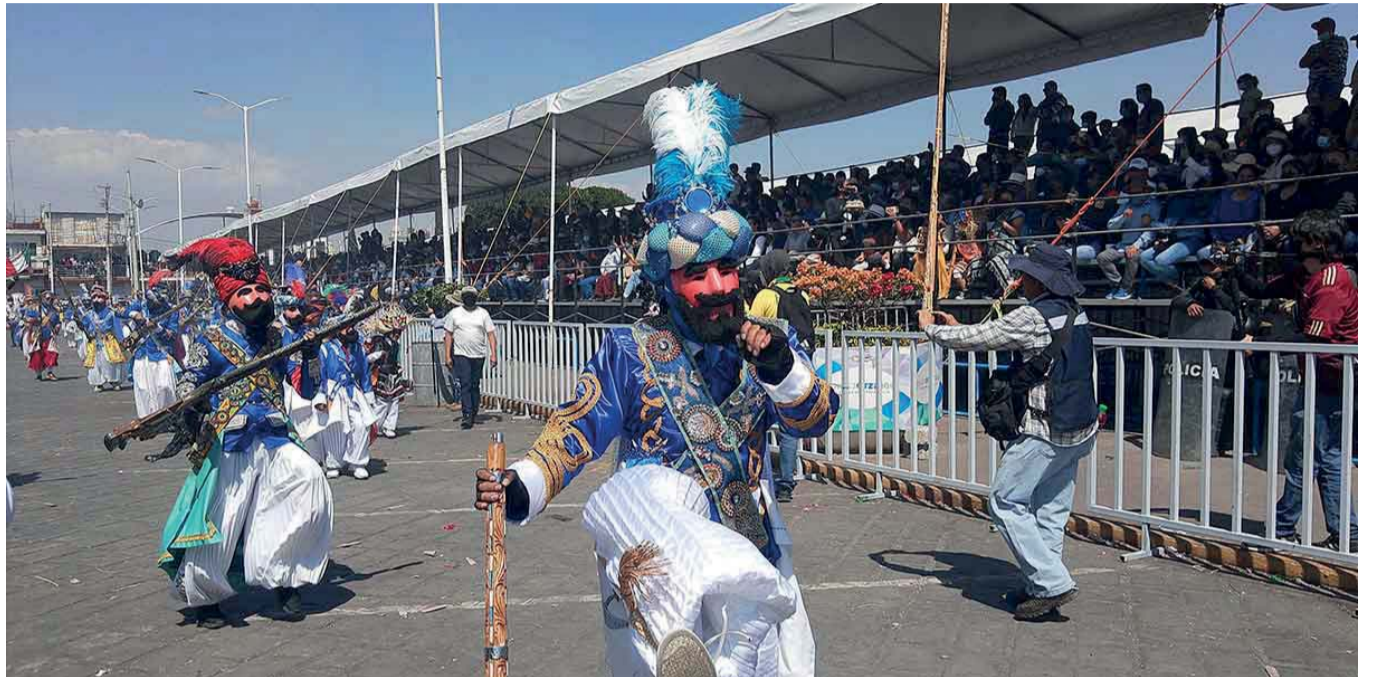
INTEGRANTES DE SU CUADRILLA Y FAMILIARES DEL LESIONADO SOLICITARON EL APOYO DE LOS CUERPOS DE EMERGENCIA, QUIENES DE INMEDIATO SE MOVILIZARON A FIN DE BRINDARLE LOS PRIMEROS AUXILIOS A ESTE HOMBRE.

Cabe mencionar que este año el Carnaval de Huejotzingo, solo se realizó los días sábado y domingo,