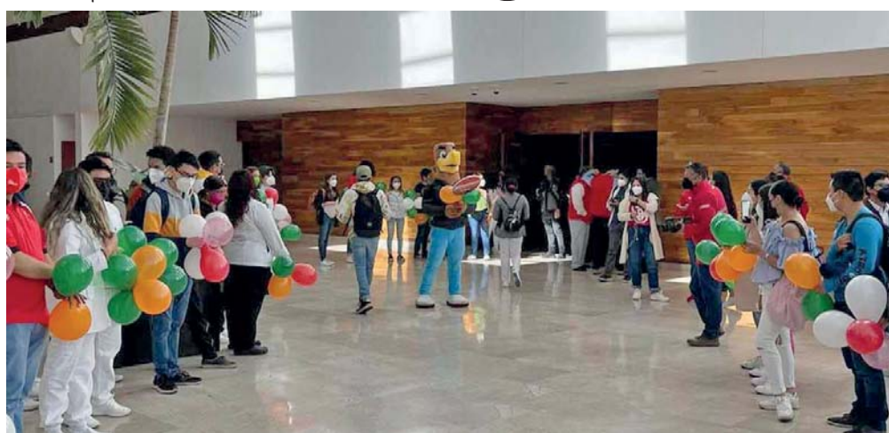
ESTUDIANTES DE LAS LICENCIATURAS EN ENFERMERÍA, MEDICINA, FÍSICA, ASÍ COMO DE NANOTECNOLOGÍA E INGENIERÍA MOLECULAR DE LA UNIVERSIDAD DE LAS AMÉRICAS PUEBLA INICIARON ACTIVIDADES PRESENCIALES EN LAS INSTALACIONES DE LA UPAEP.

Puebla, Pue- Desde el 14 de febrero de 2022 estudiantes de la Universidad de las Américas Puebla (Udlap) retomaron actividades presenciales en las instalaciones del Colegio José Gaos, Colegio Macías Rendón y la Clínica y Laboratorio Dental de la Udlap. De igual forma, a partir de este 21 de febrero cursarán talleres remediales en las instalaciones de instituciones integrantes del Consorcio Universitario de