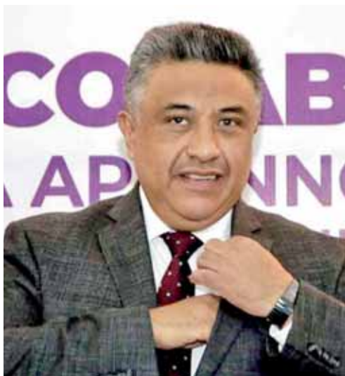
EN EL DOCUMENTO SE REITERA QUE LO ANTERIOR OBEDECE A SU PROBABLE RESPONSABILIDAD EN LA COMISIÓN DEL DELITO DE VIOLENCIA INTRAFAMILIAR EN CONTRA DE UN MENOR DE EDAD. LA MEDIDA CAUTELAR TIENE EL FOLIO 631/2021/CHOLULA.