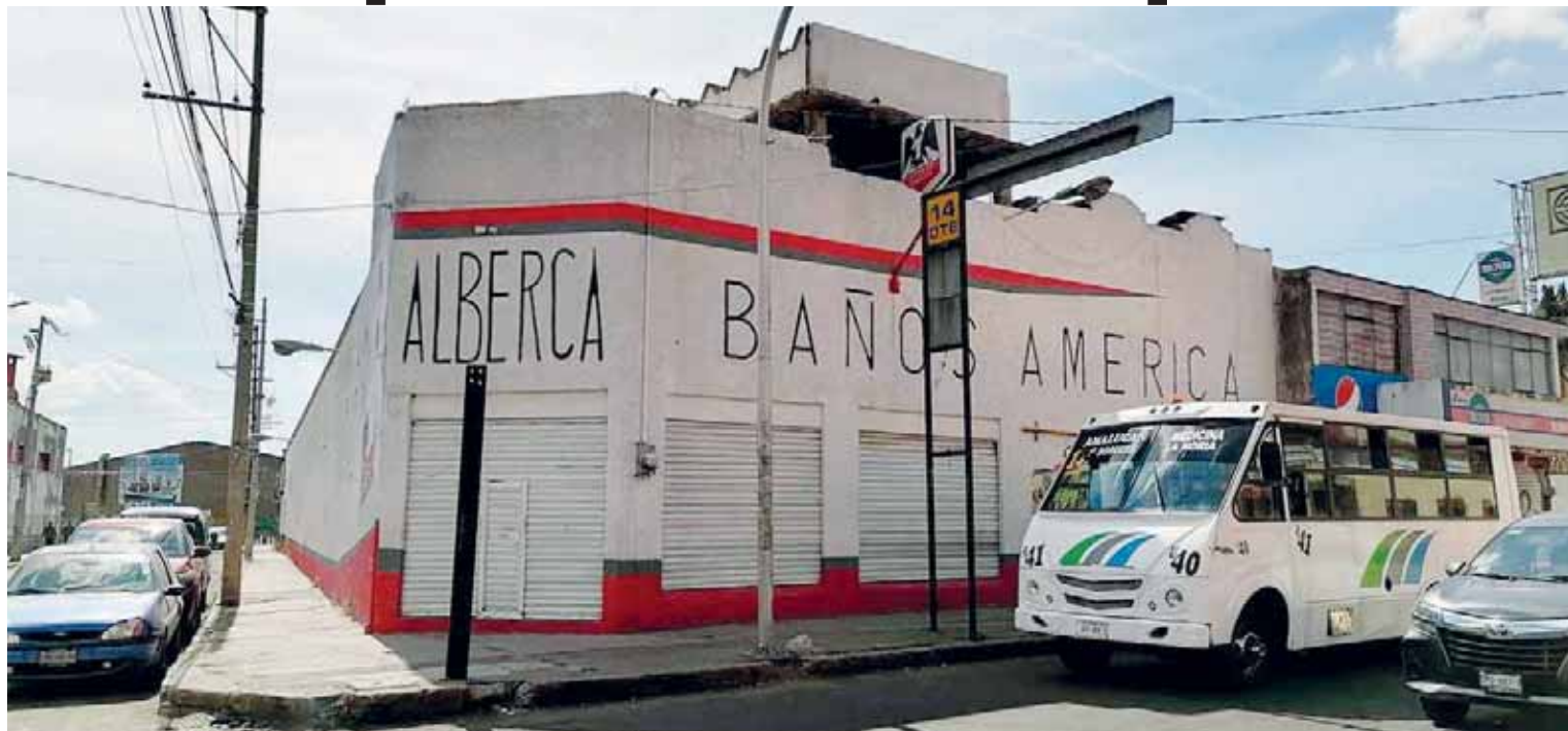
ACUSAN QUE TRABAJADORES DE AGUA DE PUEBLA SE HA PRESENTADO EN LOS NEGOCIOS PARA PEGAR REQUERIMIENTOS DE PAGO DONDE SE EXHIBEN LOS ADEUDOS QUE MANTIENEN CON LA EMPRESA.

Puebla, Pue. La Cámara de Baños Públicos y Bañeros, delegación Puebla, aseguró que en lo que va de este 2022 no se han podido recuperar en sus ingresos, pues hasta el momento se encuentran entre un 30 y 40 por ciento.