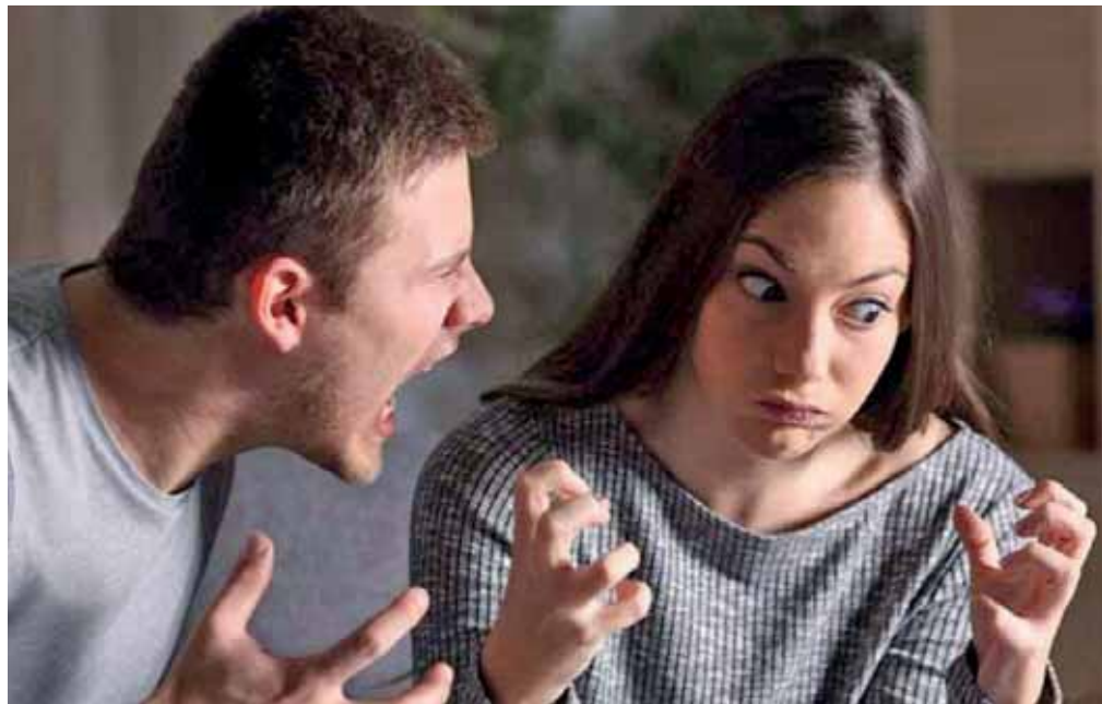
ESTABLECER EN PAREJA LOS OBJETIVOS FINANCIEROS LES DARÁ UNA VISIÓN DEL ESTILO DE VIDA QUE DESEEN LLEVAR.

De acuerdo con las estadísticas de divorcio del Instituto Nacional de Estadística y Geografía (Inegi), en 2020 la negativa a contribuir al sostén del hogar fue una de las causas de separación entre mexicanos. Hablar de finanzas en pareja es un tema delicado.