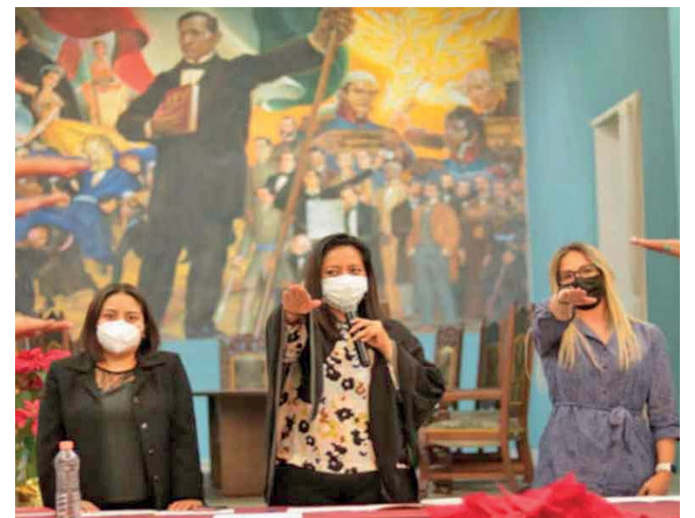
DURANTE LA PRIMERA SESIÓN DEL SIPINNA, LA EDIL DIJO SE GARANTIZARÁ LA PARTICIPACIÓN DE LOS SECTORES SOCIALES, PRIVADOS, ADEMÁS DE LA NIÑEZ Y LOS ADOLESCENTES.